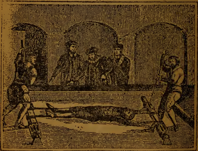
Мордованэ невинної жертви.

подібне до неба. Місце, де нема ні людської злоби, ні земських спокус, ні найменших неправильностей християнського життя. Де, пливе чисте як слеза життя, повне небесного спокою і ангельської радості. Монастир представляла я собі тоді як імітацію неба на землі. А чим в дійсності сей монастир є? Збіговиском злочинців, кримінальників, які прикрили ся монашескими шатами та з молитвою на устах мордують дітий а відтак скидають їх до отсего льоху, який я що йно відкрила. Сей колись урозний монастир-небо був в дійсності найстрашнішим пелом, де панувала зрада, брехня, доноси, сьвятотацтво найдикиші оргії та найстрашніші мордерства.