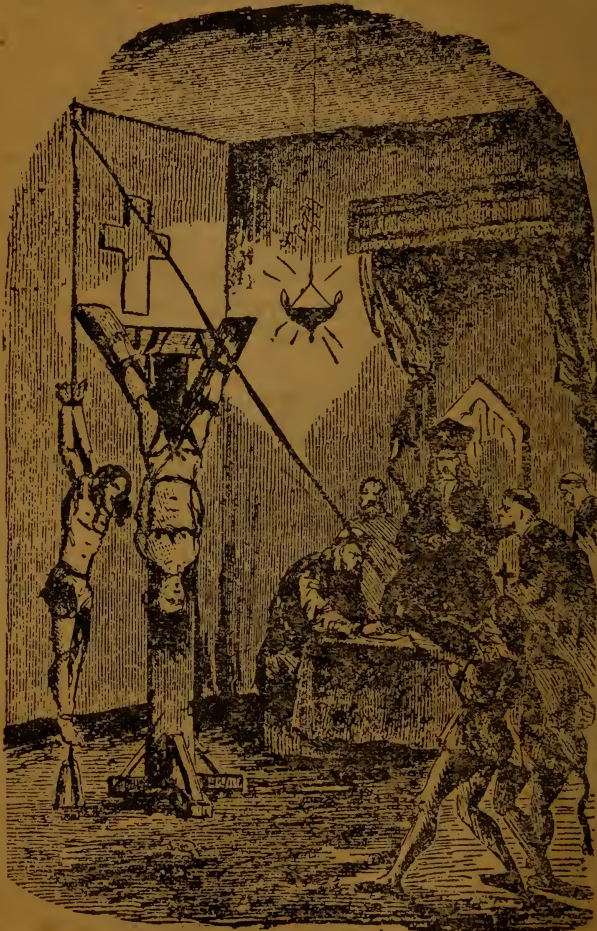
Тортурованэ монахинь в півниці монастира.

Джені ніколи не спала на своїм ліжку в однім і тімсамім місці. Коли на дворі почало тепліти, тоді она відтягала ліжко