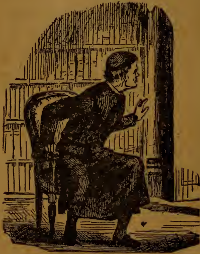
Нелюдский піп, Бонін.

Робили всьо що могли, щоб не лише бідну жертву вдусити між обома ліжками але навіть і роздусити. Одні вставали на ноги а відтак зі всеї сили скакали на бідну дівчину, инші підскакували на колінах, а всі прочі старались знайти який-небудь спосіб, щоб як найлучше мож було видусити з бідної жертви послідний віддих. Таке мученэ відбувалось з найбільшим запалом, і мені здавалось, що бідна сьв. Францішка вже чисто розмагльована, а сї мордерці эще з неї не злазили. Мені здавалось, що таке мордованэ їх вдоволяэ, а навіть справляэ приємність, бо торожили свою сестру а сего не бачили, бо они товклись всі на ліжку під яким она була придусина до другого.