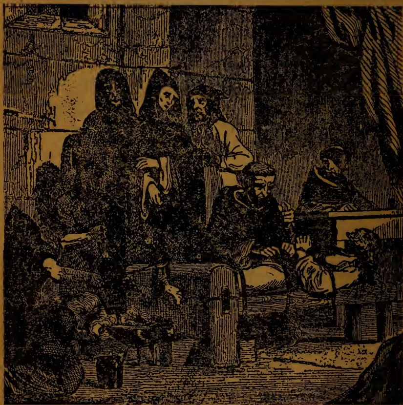
Припіканє ніг монахинь аж до віддання духа.

перестрашилась, бо побачила одну монахиню повішену в сій комнаті до гори ногами. Ноги були привязані ремінним пасом до кільця в стелі, а щоб і убранє з неї не спало в долину приязано до тіла ремінцями. Голова мало що не дотикалась до