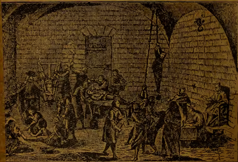
Тортування монахинь в монастири.