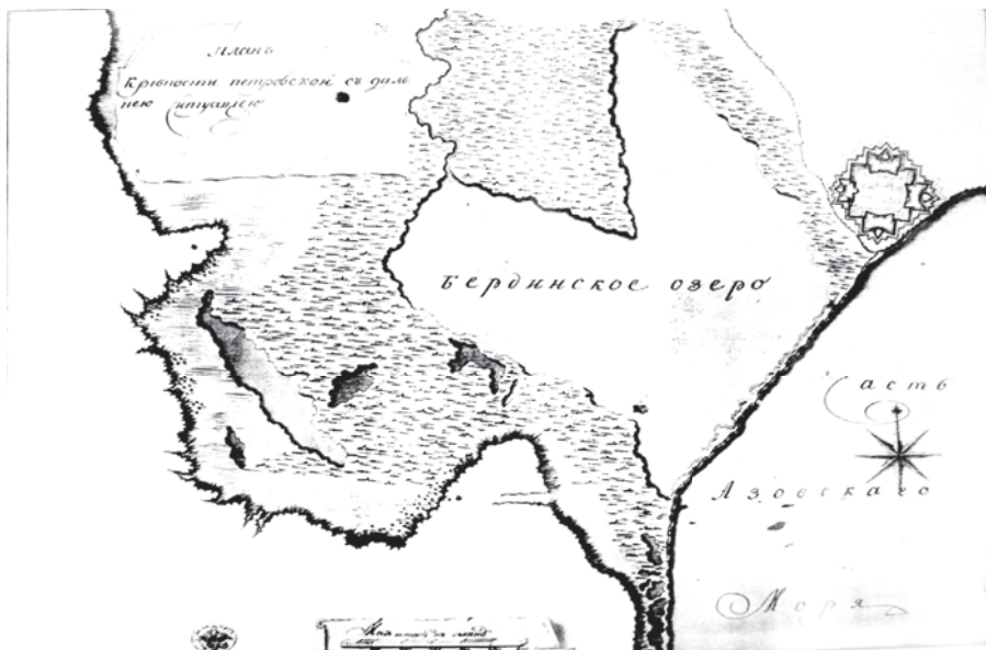
План Петрівської фортеці 1771 р.