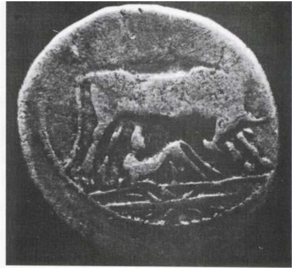
Рис. 3. Монета, що походить з Іллірійської Апполонії (II ст. до н.е.) [25, с. 33].