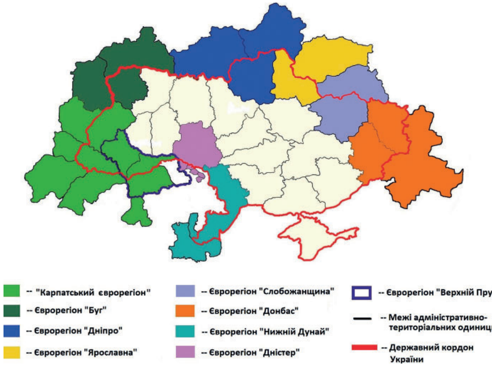
Рис. 1. Євро регіони в Україні

ливості (зокрема в аспекті тісної співпраці із європейськими інвестиційними фондами), ніж євро регіони, утворені із країнами, які не входять до складу ЄС. Останні характеризуються значно нижчими інтенсивністю контактів та розгалуженістю соціально-економічних, гуманітарних зв'язків між регіонами України та регіонами країн-партнерів.