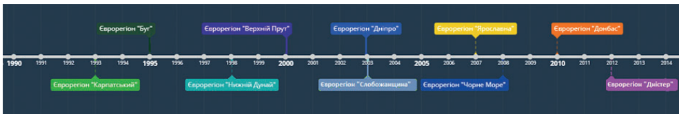
Рис. 2. Часовий графік створення євро регіонів за участю України.