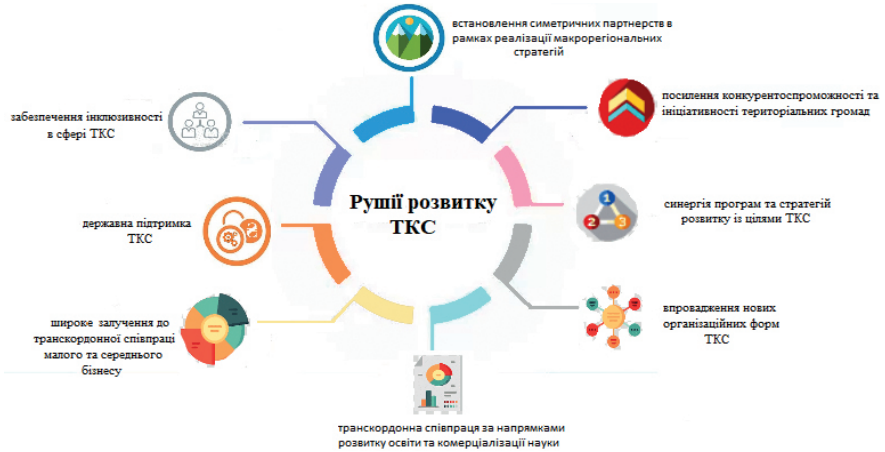
Рис. 5. Рушії розвитку транскордонного співробітництва.