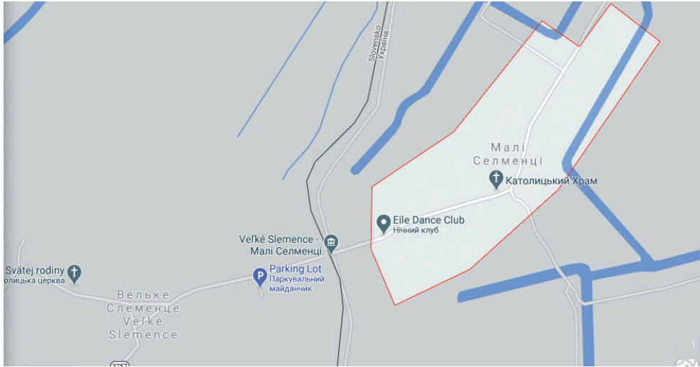
Рис. 4. Малі Селменці та Velké Slemence

До прикладу – реалізація такої інституціалізованої форми ТКС як євроокруг була б доцільною в транскордонній зоні між селищами Малі Селменці (Закарпатська область, Україна) та Velké Slemence (Кошицький Край, Словачька Республіка), що історично були одним населеним пунктом, але нині розділені українсько-словацьким кордоном (рис. 4).