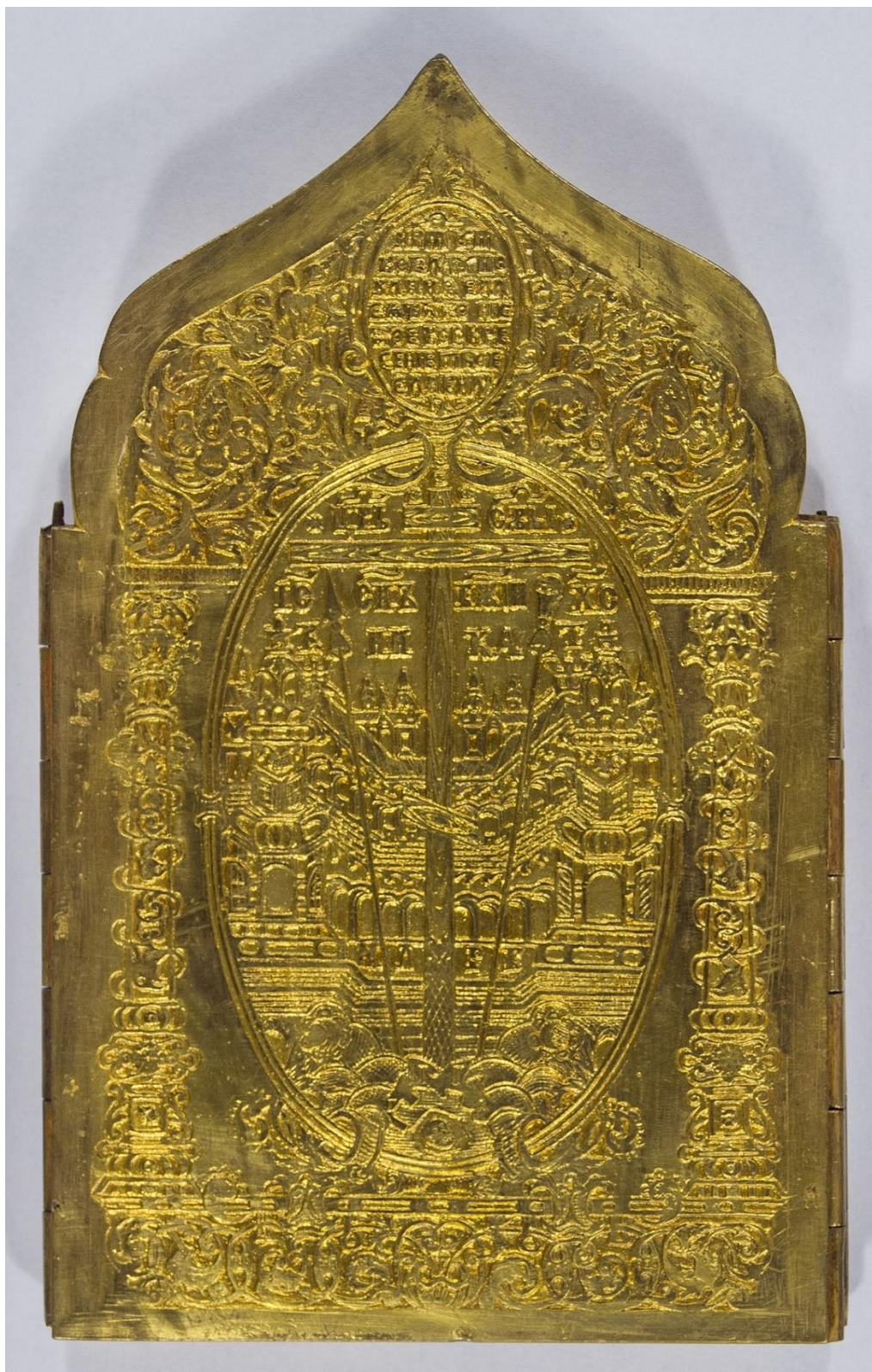
Фрагмент ікони-складня «З двома десятими святыми» (Фонди ДНІМ імені Д.І. Яворницького; К – 632, КП – 35432)