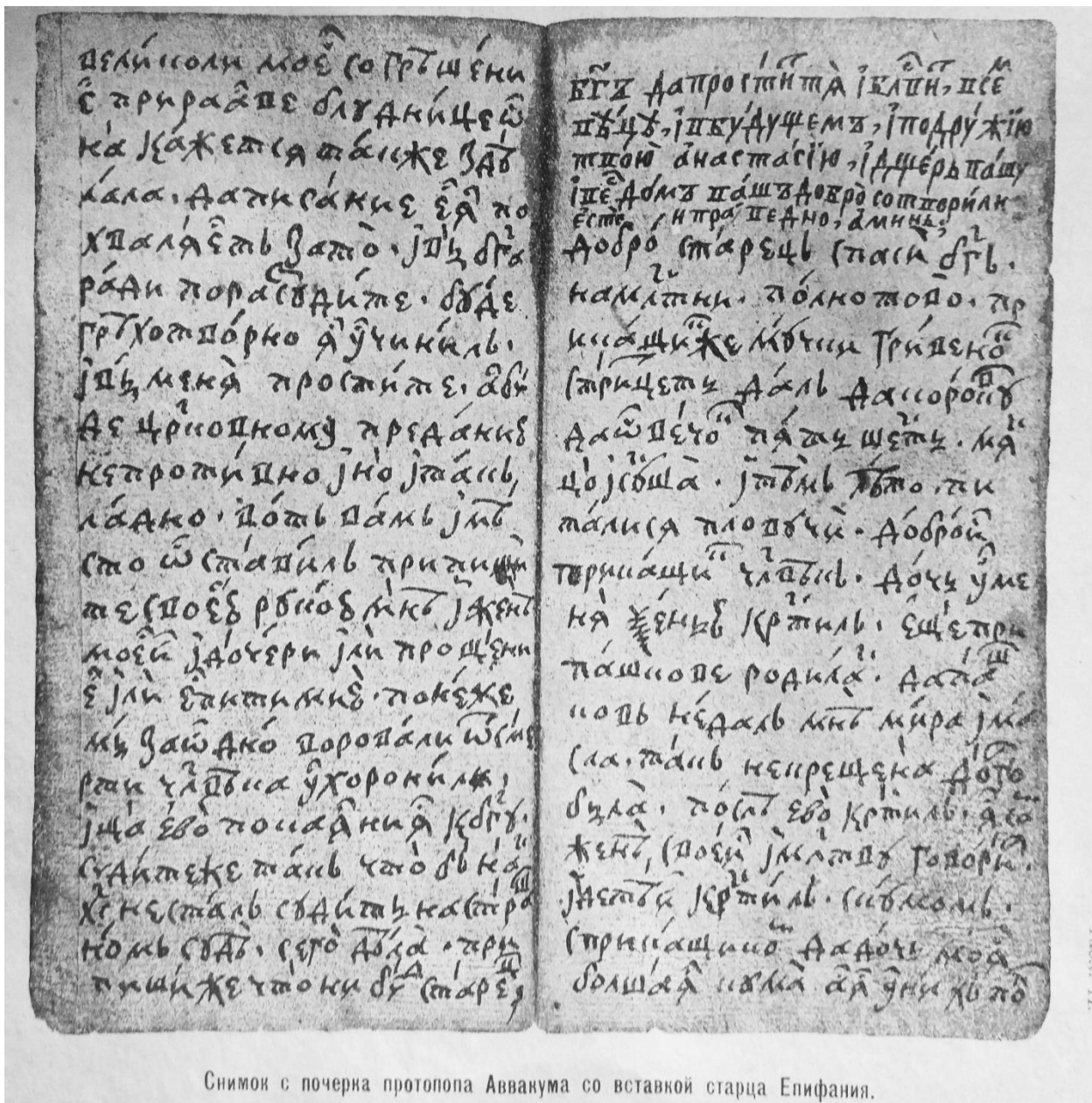
Снимок с почерка протопопа Аввакума со вставкой старца Епифания.