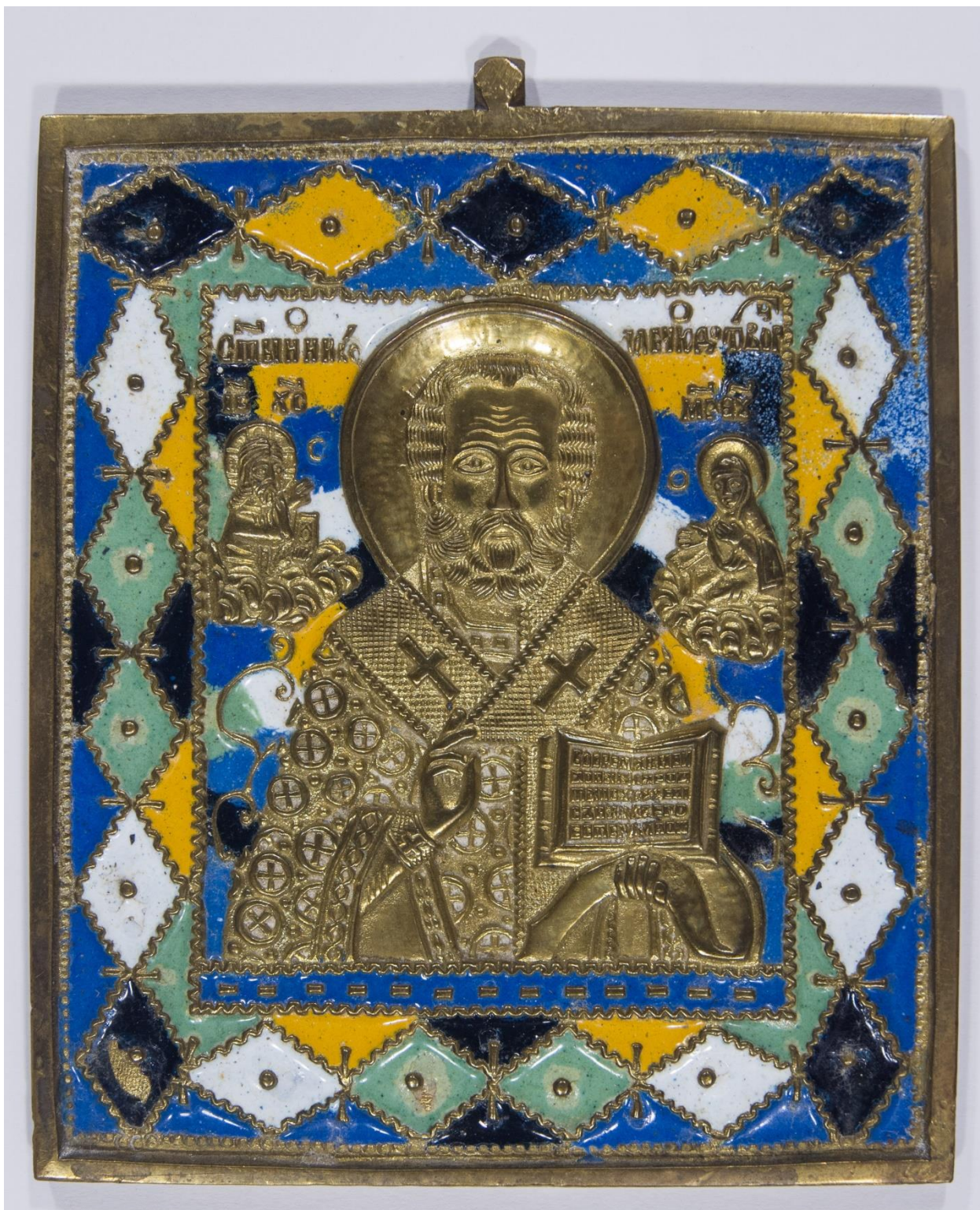
Ікона «Микола Чудотворець» ХІХ ст.

(Фонди ДНІМ імені Д.І. Яворницького; К – 2278; КП – 162124)