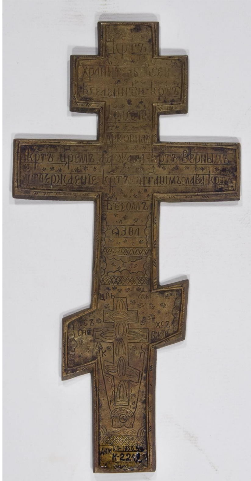
Хрест-складень напрестольний (зворотня сторона)

(К – 2242, КП – 143640)