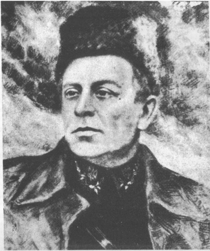
Головний Отаман Симон Петлюра

Симон Петлюра — Жертва подвійного морду з рук жидів. Большевицький агент, жид Шварцбарт, що на доручення Москви застрілив у Парижі С. Петлюру, виступив на суді як „месник жидівського народу” і таким його прийняли жиди. Тоді, і до сьогодні, поповнюють жиди морально-політичний морд, знеславляючи Петлюру як кривавого „погромщика жидів”, всупереч доказаному вже фактові, що Петлюра не тільки ніколи ніякої участі в жидівських погромах участі не брав, ані до них не закликав, але якраз навпаки — як Головний Отаман видав спеціальний наказ армії УНР не дати спровокувати себе до якихсь погромів і ініціював спеціальні права для жидів у конституції Української Держави, яких жиди в ніякій державі не мали й не мають.