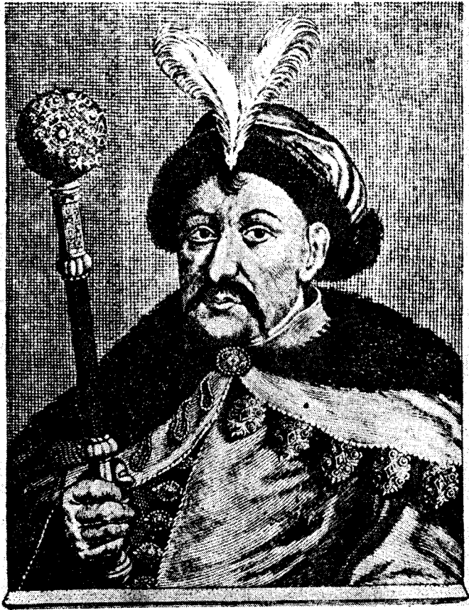
Гетьман Богдан Хмельницький

Як провідник всенародного повстання українського народу Богдан Хмельницький прогнав польських окупантів з України і відновив самостійну Українську Державу. Тому, що в кривавих війнах тоді поруч ок. триста тисяч українців і стільки ж поляків згинulo теж приблизно десять тисяч жидів, або як озброєні члени частин польського війська „посполіте рушене”, або з рук месників за кривди і наруги, заподіяні українському населенню на службі польських окупантів, жида зневажають Хмельницького як одного з найгірших „погромщиків” і „антисемітів” всупереч фактові, що жид Герцик був фінансовим міністром Хмельницького, а жид Маркович старшиною козацької армії Хмельницького.