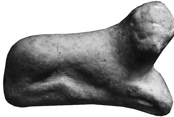
Рис. 1. Теракота пізньоархаїчного періоду.

Серед представлених в експозиції речей до пізньоархаїчного періоду (поч. VI – поч. V ст. до н. е.) належить: