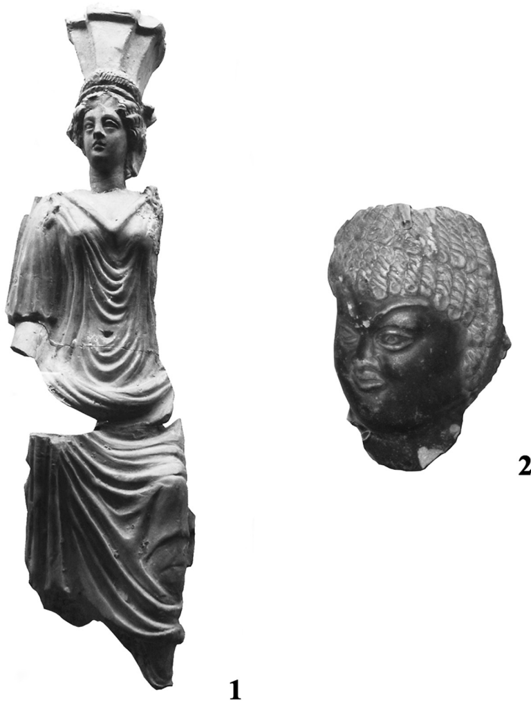
Рис. 4. Теракоти пізньоелліністичного та римського періодів.

8. Жіноче погруддя – Деметра(?) – БЗ–2828 (рис. 3-2). Обличчя з м'яко модульованими рисами: чоло високе; очі глибоко посажені; нижні повіки згладжені; ніс масивний; рот великий з пухкими губами; щоки трохи вдавлені; підборіддя важке. Одягнений у хітон з глибоким трикутним вирізом на грудях. На голові – калаф у формі перевернутого зрізаного конуса, прикрашений рельєфним листям. Навколо голови – пов'язка, декорована поперечними насічками. Над чолом – вінець з наліпним листям та двома коримбами. Калаф, пов'язка, вінець є атрибутами богині Деметри. Поверхня фігури вкрита ангобом (висота 186 мм, ширина головного убору 80 мм). Аналогічна теракота, знайдена на агорі Ольвії, датується IV–III ст. до н. е. [10, 99; 5, 41].