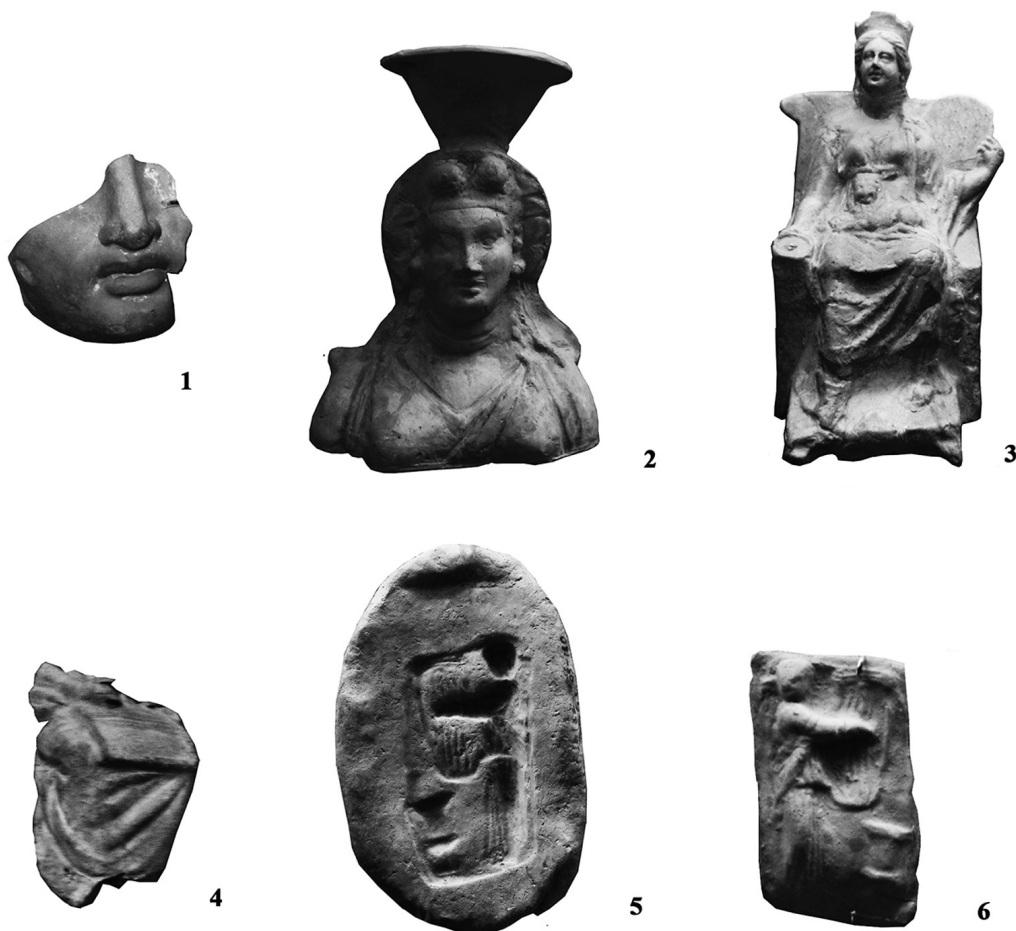
Рис. 3. Теракоти елліністичного періоду.

5. Жіноча голова – Деметра(?) – Б3–2831 (рис. 2. 4). У діадемі з трикутними виступами, з кучерявим волоссям, поділеним прямим проділом, з сережками у вухах. Обличчя овальне, трохи подовжене, з крупними, чіткими рисами; надбрівні дуги трохи заокруглені; очі невеликі; ніс прямий, масивний; рот великий з пухкими губами; підборіддя важке. На обличчі залишки білої фарби (висота 53 мм). Аналогічне зображення голови знаходиться у Державному Ермітажі і датується першою пол. IV ст. до н. е. [10, 87; 5, 54].