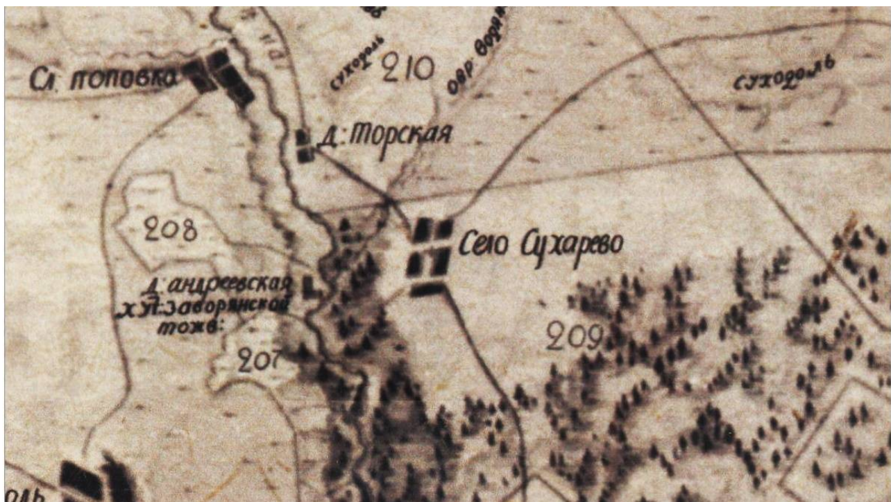
Іл. 5. Фрагмент карти. 1797 р.