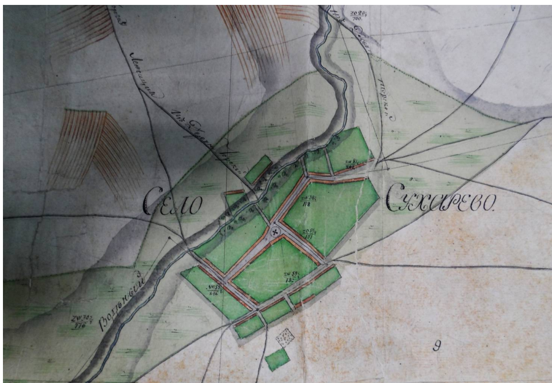
Ил. 1. Фрагмент карты. 1813 г.

Старобельские округа военного поселения / Филарет (Гумилевский Д. Г.). – Харьков : Типография Харьковского университета, 1858. – С. 461.