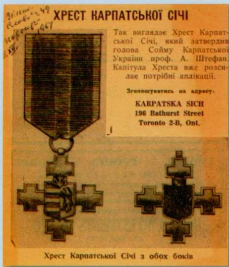
Хрест Карпатських Січовиків за проектом Ю. Сас-Подлуського