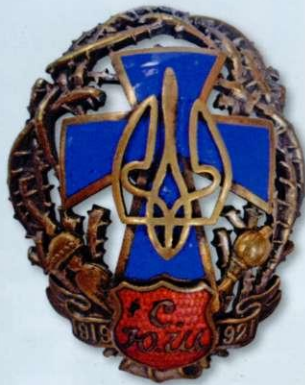
Знак Спільної Юнацької Школи I видання