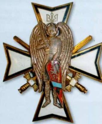
Хрест «За Другий зимовий похід»