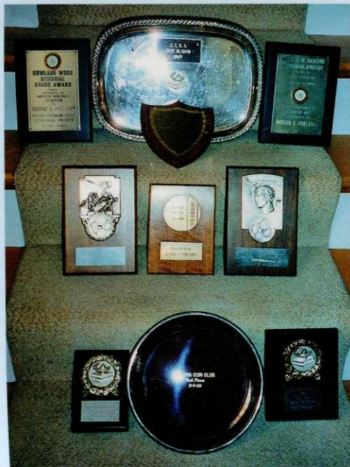
Численні нагороди Юрія Сас-Подлуського