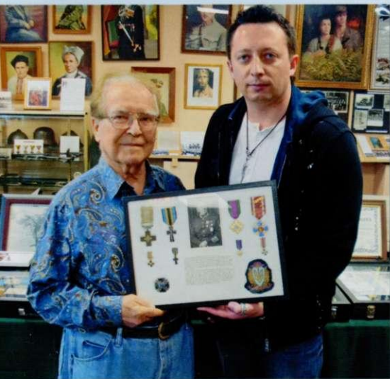
Автор з доктором Ю. Сас-Подлуським демонструють нагороди генерала-хорунжого армії УНР Олександра Загородського.