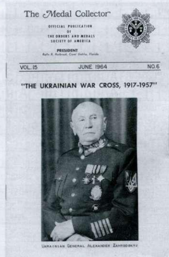
На обкладинці журналу «The Medal Collector» генерал Армії УНР О. Загородський.