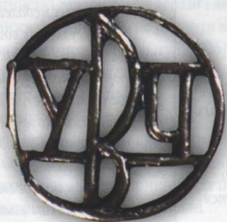
Рис. 10. Відзнака корпорації "Заграва" в Кракові