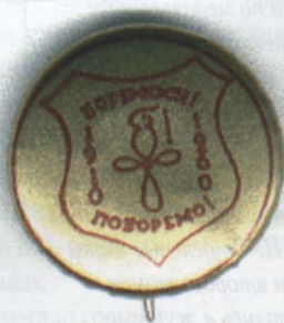
Рис. 13. Відзнака до 50-ти річчя корпорації "Запороже" в Чернівцях