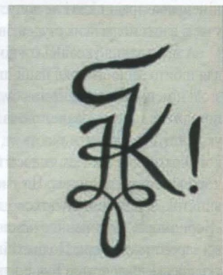
Рис. 6. Відзнака корпорації “Галич” в Данцигу