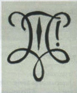
Рис. 14. Відзнака корпорації "Хортиця" в Кракові