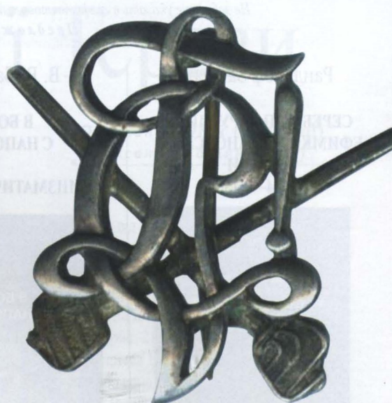
Рис. 7, 8, 9. Невизначені відзнаки студенських корпорацій