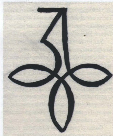
Рис. 5. Відзнака головного убору корпорації “Зарево”