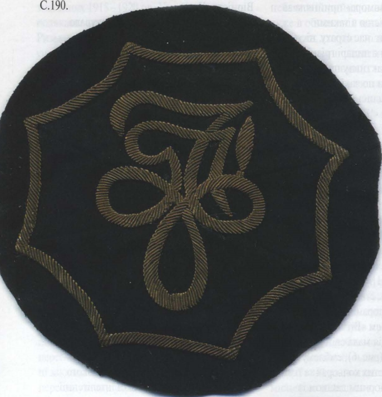
Рис. 2. Відзнака-нашивка з головного убору корпорації “Чорноморе”