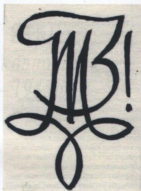
Рис. 4. Відзнака корпорації “Зарево” в Данцигу