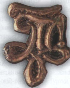
Рис. 3. Відзнака корпорації “Чорноморе”