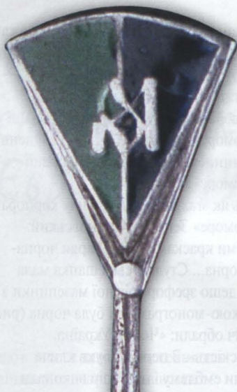
Рис. 1. Відзнака студентського товариства “Основа” в Данцигу