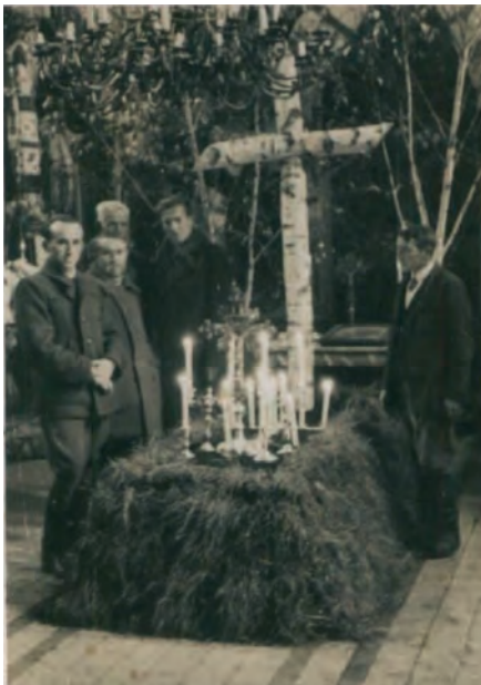
Символічна могила полеглим воякам УСС та УГА в Успенській церкві м. Підгаєць. Світлина 1927 – 1928 рр.

Підгайцях. 1938-го року заборонено на шарфах при вінках поміщувати будь-які написи, а похід мусів мати форму процесії, а не зорганізованого маршу чвірками” 12 .