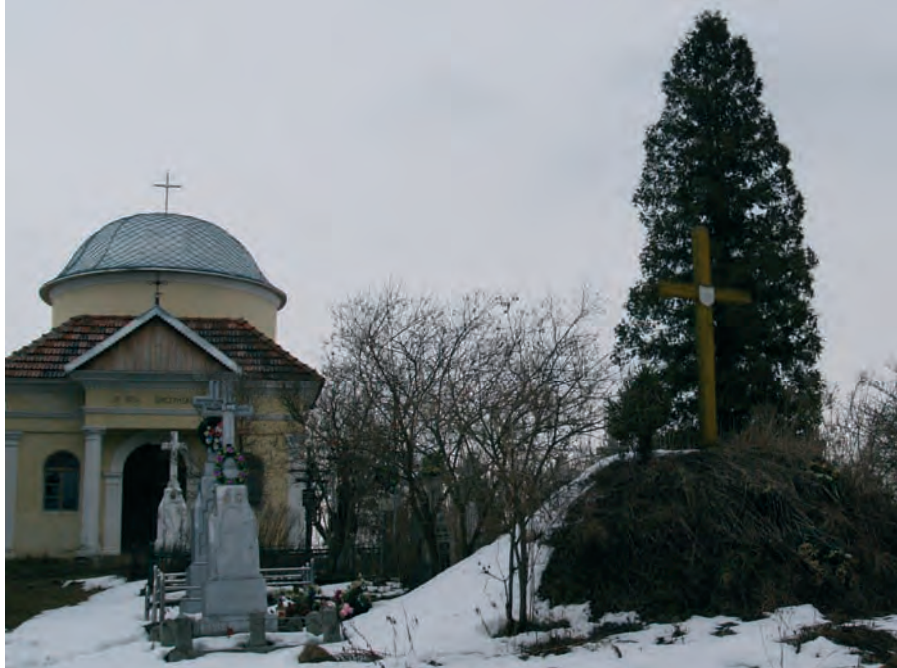
Могила Івана Балюка (праворуч) на цвинтарі у с. Заставчому. Світлина 2010 р.

Із Завалова прямуємо до Підгайців. Саме так — через Яблунівку і Угринів — ішов 28 серпня 1915 року другий курінь УСС. Звідси він наступного дня разом із 130-ю бригадою вирушив до Новосілки (тепер Підгаєцького району). Виходячи із Підгайців, минали вояки Загайці, неподалік яких край шляху і дотепер височить могила, де спочивають вічним сном козаки гетьмана Петра Дорошенка, що полягли у жовтні 1667 року у битві під Підгайцями з польським військом Яна Собеського, борючись за єдину Україну, поділену навпіл Андрусівським перемир'ям між Польщею та Московією.