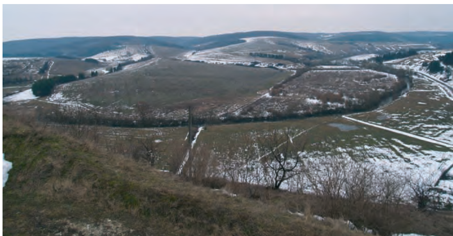
Село Завалів. Загальний вигляд річки Золота Липа та дороги, якою йшов перший курінь УСС. Світлина 2010 р.

лися на фланг російського війська, і їм довелося дещо відступити. Та вже 1 вересня усусуси пройшли через Бурканів і Панталиху й зупинилися на полях між Тютьковим і Бернадівкою (нині Лощинівка, всі вищеназвані села належать до Тербовлянського району).