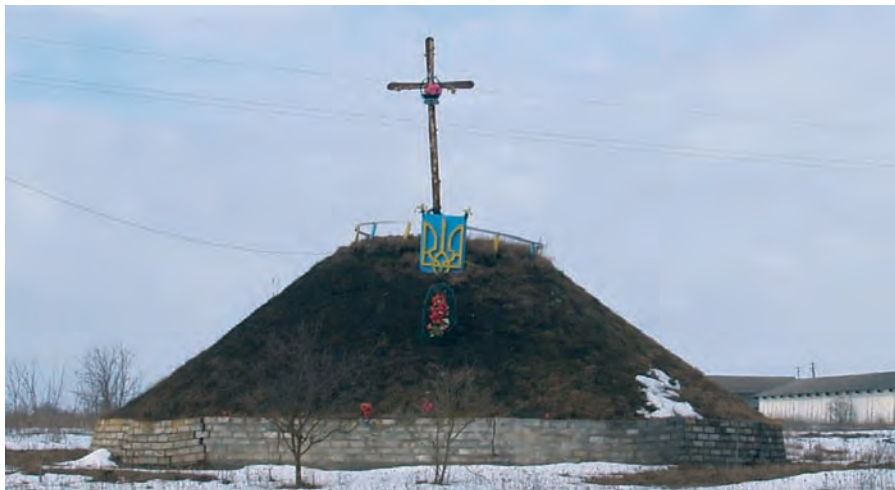
Село Семиківці. Могила полеглих героїв у 1916 р. Світлина 2010 р.

„Ми пішли в цю світову завірюху тільки тому, щоби наша Україна в часі цього всесвітнього, смертельного змогу могла проголосити, що є і хоче бути, хоче мати власне місце під сонцем. Коли що тривожить нас, то