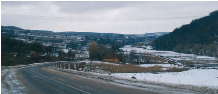
Село Яблунівка. Цією дорогою йшов другий курінь УСС. Світлина 2010 р.