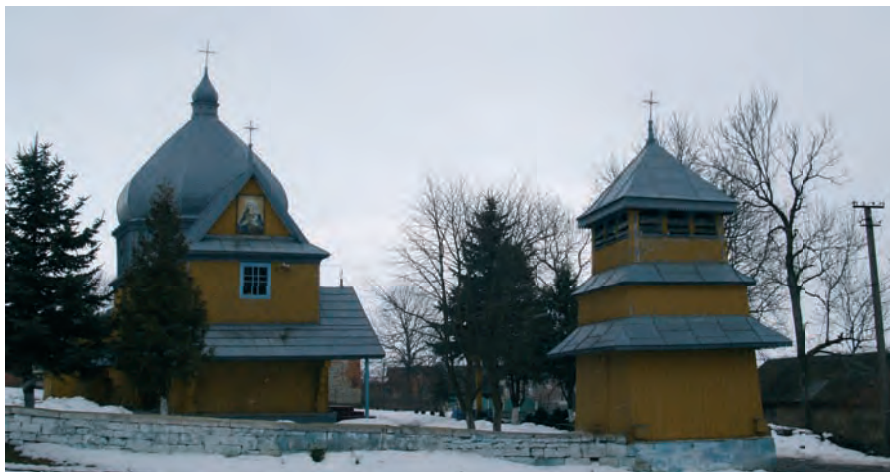
Церква Різдва Пречистої Диви Марії у с. Новосілці-Ленчівці, де восени 1915 р. молились учасники Пресової квартири УСС. Світлина 2010 р.