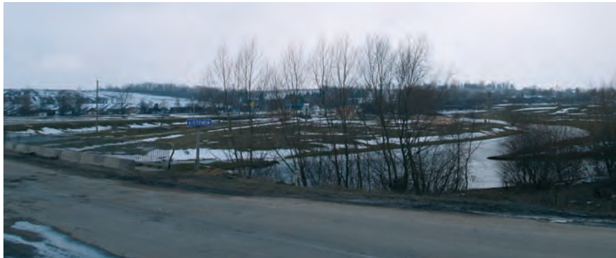
Міст через річку Стрипу поблизу с. Соколів. Світлина 2010 р.

відбили кілька атак, але росіяни проломили фронт і перейшли Стрипу в іншому місці — біля Соکیلників.