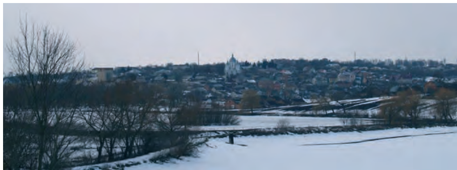
Підгайці. Загальний вигляд зі сходу. Світлина 2010 р.