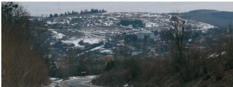
Загальний вигляд с. Завалів і гори Карачин. Світлина 2010 р.