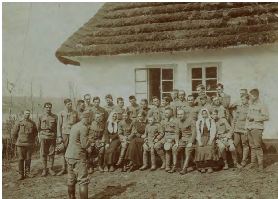
Усусуси в короткі хвилини відпочинку. Світлина 1915 р.

Тепер повернімося до Соснова. Саме у цьому селі та поблизу нього розташувалися після семиковецьких боїв на так званих зимових квартирах усусуси. Соснів вони застали зрівняним із землею, люди були евакуйовані. Стрільці швидко дали лад зруйнованим хатам і стоδοлам. Забезпечивши себе житлом, налагодивши побут, взялися будувати другу оборонну лінію та греблю через багнисту долину Студинки. Відновилися зв'язки з рідними, студенти, яких було серед стрільців чимало, отримали змогу скласти іспити. А для неписьменних організували на зимових квартирах курси читання й писання рідною мовою.