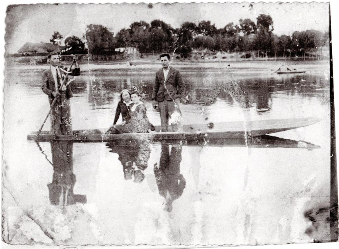
Фото 6. Жителі м. Опалин під час відпочинку на р. Буг. 1940 р.

Фото 5. Поліський рибалка на човні. О. Цинкаловський. Стара Волинь і Волинське Полісся. Т. 1. Вінніпег , Канада, 1984. С. 190.