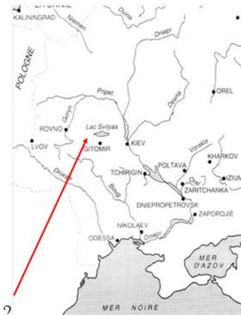
Рис.2. Карта за В. Шепелевим. Озеро Світязь чомусь позначено північніше м. Житомира.