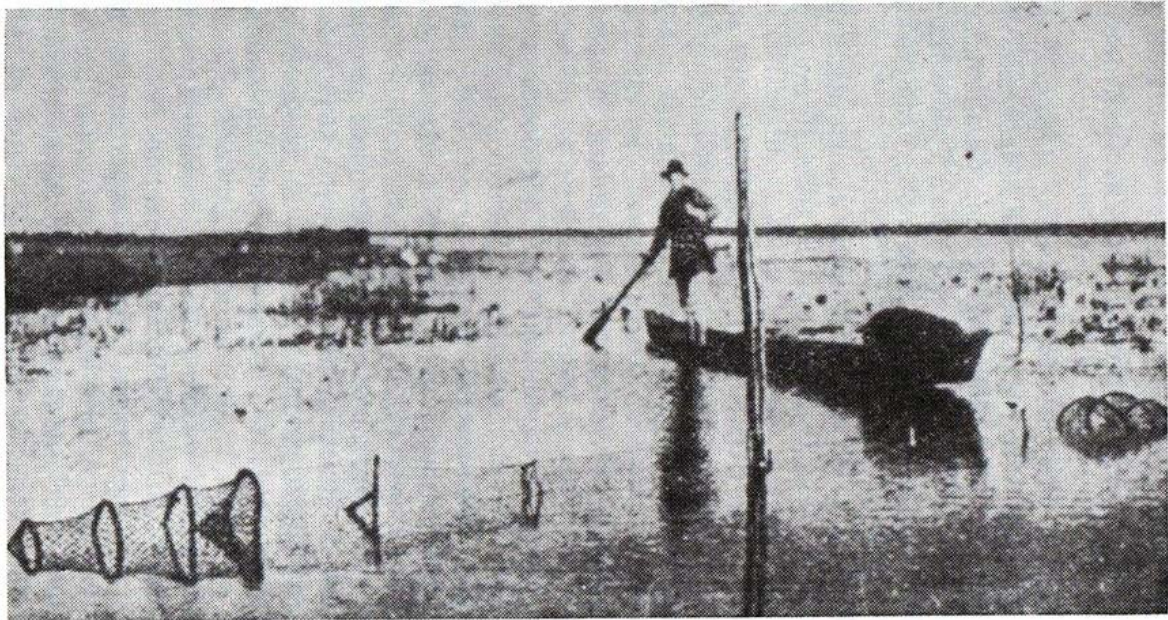
Поліський рибалка (ц).

Фото 5. Поліський рибалка на човні. О. Цинкаловський. Стара Волинь і Волинське Полісся. Т. 1. Вінніпег , Канада, 1984. С. 190.