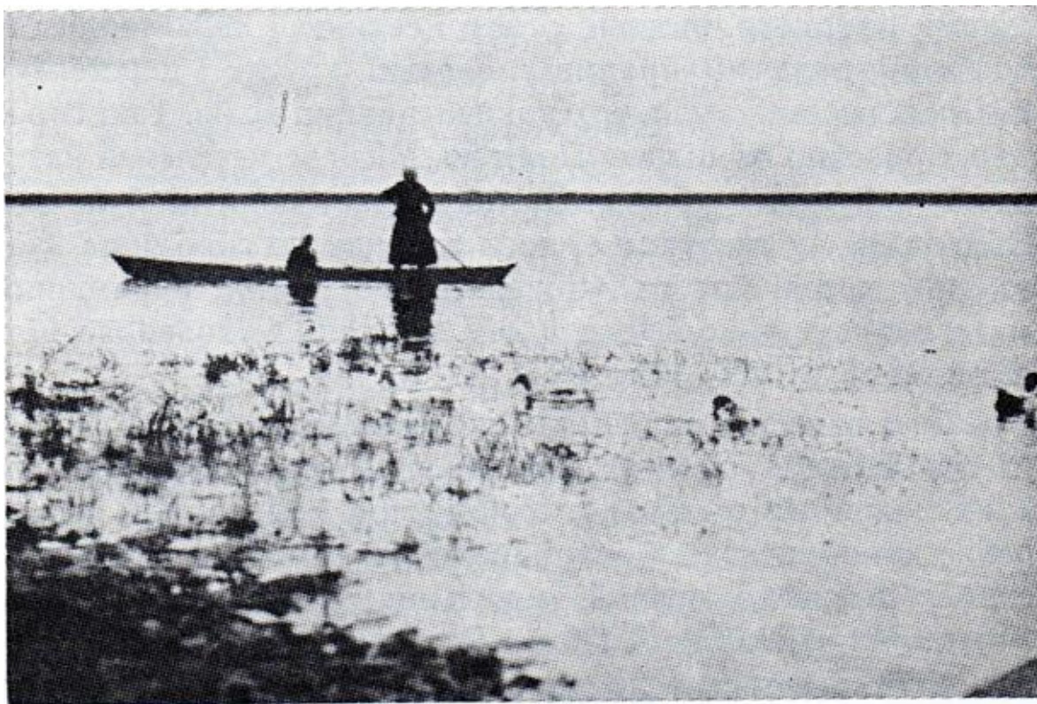
Ріка Ясельда біля Городища на Поліссю.