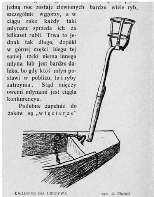
Фото 1. Світильник з лучиною. Журнал «Ziemia» № 5. Warszawa, 1911 r. S. 70