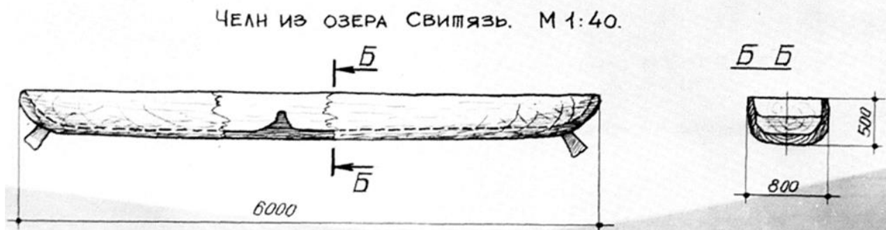
Рис.1. Малюнок човна-довбанки із озера Світязь ( за В. Шепелевим).

Нами неодноразово була висловлена думка щодо перспективності започаткування на Волині нової галузі допоміжної історичної науки – підводної археології або в більш ширшому розумінні гідроархеології [7, 110]. Озеро Світязь - найбільше та найглибше природного походження в Україні, належить до групи Шацьких озер. Поточне дослідження випадково виявленого на озері Світязь давнього човна-довбанки підкреслює його потенціал у майбутніх програмах досліджень. Майбутнє детальне дослідження виграє від виявлення більшої кількості простих плавзасобів, що звичайно вимагатиме систематичних підводних археологічних вишукувань. Проведення регулярних експедицій дозволить виявити та музеєфікувати ще ряд пам'яток давнього суднобудування.