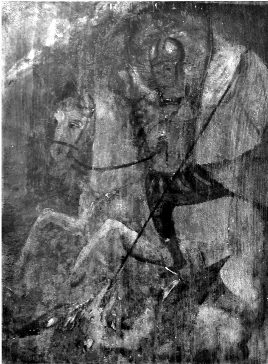
Рис. 7. Ікона «Георгій Змієборець», XVII ст. Дерево, олійні фарби.

11 вересня 2008 р. НІКЗ «Гетьманська столиця» передав до ННДРЦУ на реставрацію п'ять ікон. Дві з них – «Варвара Великомучениця» 4 [4] (рис. 4) та «Миколай Угодник» 5 [5] (рис. 5), які у 1998 р. надійшли від мешканки м. Конотоп Сумської обл. К. Камардіної, були пошкоджені шашелем та мали відшарування фарби. Дві інші ікони – «Хрещення Господнє» 6 [6] (рис. 6) та «Георгій Змієборець» 7 [7] (рис. 7), які передала мешканка м. Батурин Н. Яценко, також мали значні втрати фарби та пошкодження шашелем. Ікона «Святий Преподобний Устиніан» 8 [8] (рис. 8) була придбана у мешканки м. Батурин Н. Чемен зі значними візуальними пошкодженнями. Реставраційно-консерваційні заходи проводили художники-реставратори О. Фролова («Варвара Великомучениця» [17] та «Миколай Угодник» [18]), О. Корнієнко («Святий Преподобний Устиніан» [19]), Л. Когут («Хрещення Господнє» [20]) та В. Миргородський («Георгій Змієборець» [21]). У 2009 р. ці пам'ятки повернулися до фондів заповідника.