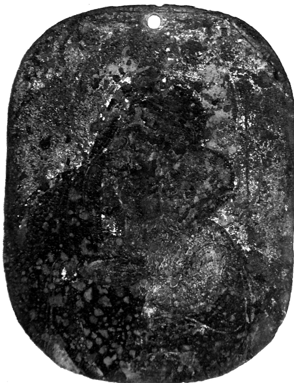
Рис. 3. Ікона «Божа Матір з Немовлям», XVII ст. Мідь, позолота.