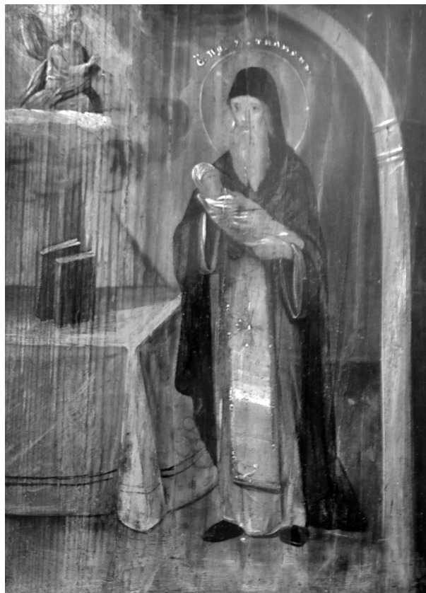
Рис. 8. Ікона «Святий Преподобний Устиніан», кін. XIX ст. Дерево, олійні фарби.