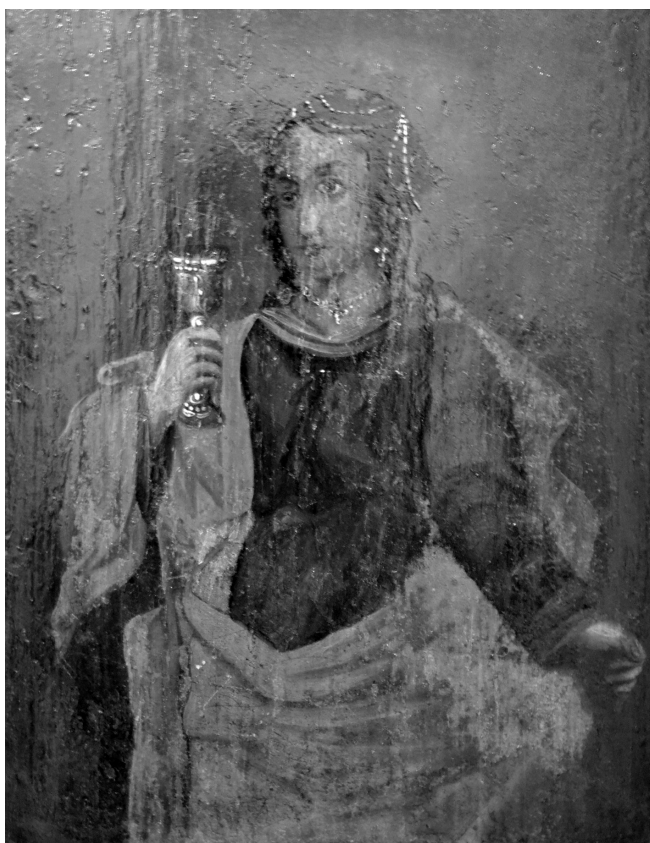
Рис. 4. Ікона «Варвара Великомучениця», кін. XVIII ст. Дерево, темпера.