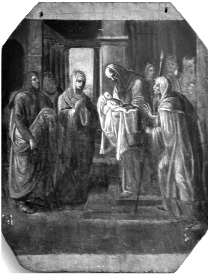
Рис. 2. Ікона «Стрітєння Господнє», XVII ст. Дерево, темпера.