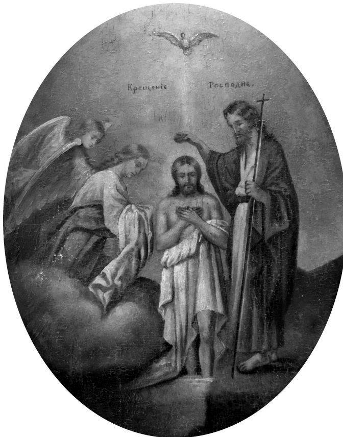
Рис. 6. Ікона «Хрещеніє Господнє», ХІХ ст. Дерево, олійні фарби.