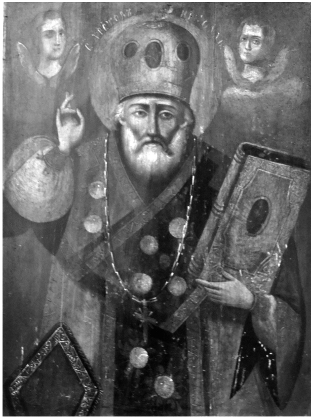
Рис. 5. Ікона «Миколай Угодник», серед. ХІХ ст. Дерево, олійні фарби.