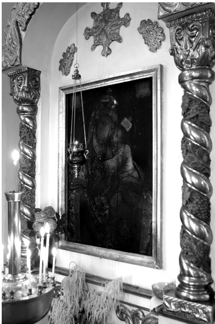
Рис. 11. Ікона «Повчанської Божої Матері». Дерево, олія, скло.

історичну цінність, тому що пов'язана з родиною Розумовських: на початку XIX ст. цю ікону передав до церкви-усипальниці син гетьмана К. Розумовського. За візуальним спостереженням можна припустити, що означену ікону реставрували, про що свідчить нерівномірність фарбового покриття і залишки лаку. Робота невмілого маляра, який вимастив білою фарбою дерев'яну основу ікони, псує її зовнішній вигляд. Загрозу для ікони становить виявлені на звороті пошкодження шашелем [12]. На прохання НІКЗ «Гетьманська столиця» про проведення реставраційно-консерваційних заходів церковна громада відповіла відмовою, аргументуючи це тим, що ікону їм більше не повернуть.