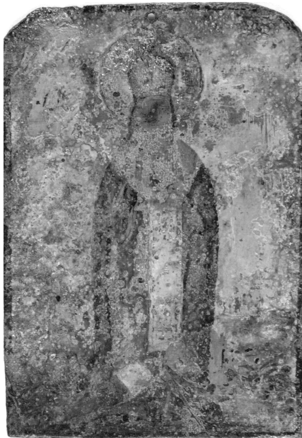
Рис. 9. Ікона «Богородиця з Предстоячими та Святого в повний зріст», кін. XVII ст. Мідь, олія.