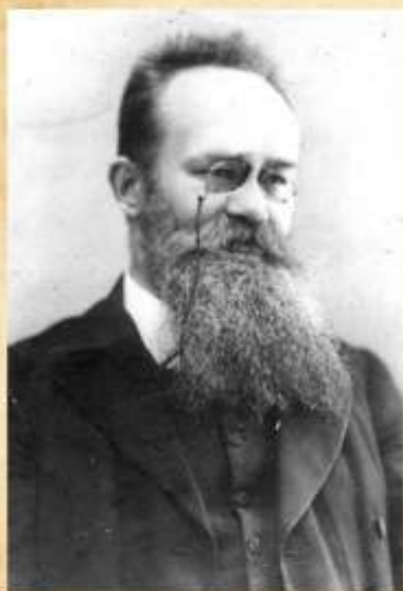
Михайло Сергійович Грушевський (1866—1934)

Сьогодні, у рік символічного збігу дат, 25-ї річниці Незалежності України і 150-річчя від народження М. Грушевського, ми знову звертаємося до політичної спадщини патріарха української державності, де він окреслив головні контури тієї Великої України, будувати яку випало на нашу долю, творити її внутрішню і зовнішню політику. Вказуючи на перспективи відродження України, духовного і економічного визволення народу, Грушевський заповідав нам передусім "знайти себе", свою стежку в світовому історичному процесі, "свою долю і свій шлях широкий".