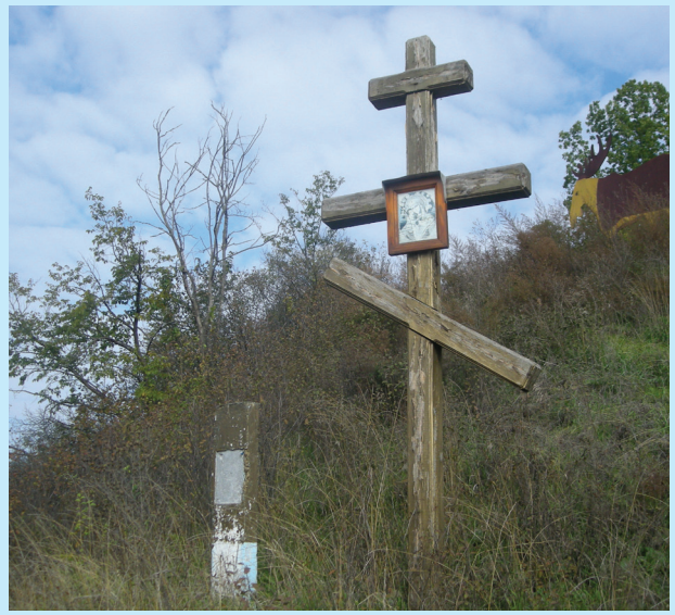
15 Городне. Хрест від краснокутських козаків та стовпчик, де була табличка Харківської обласної ради. Фото 2013 р.