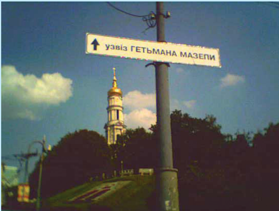
12 Харків. Узвіз гетьмана Мазепи 2008 р.