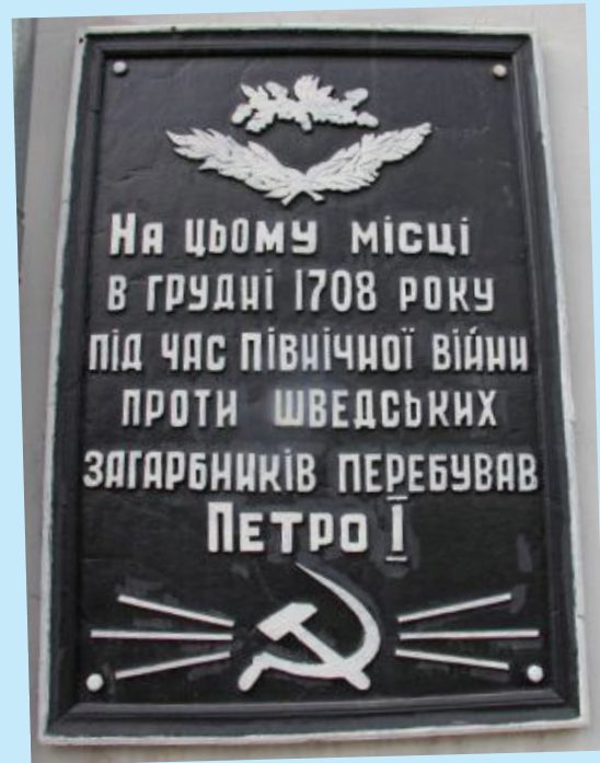
6. Пам'ятна дошка в місті Лебедині (Сумська обл.) про перебування Петра Першого