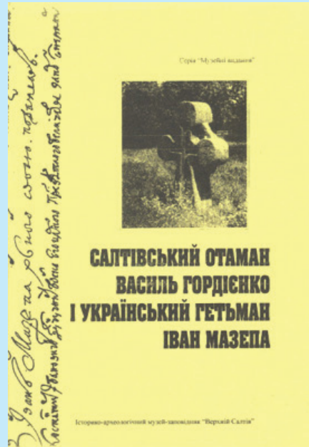
21 Обкладинка малопрístupної книжки про гетьмана Мазепу і Харківщину. 2009 р.