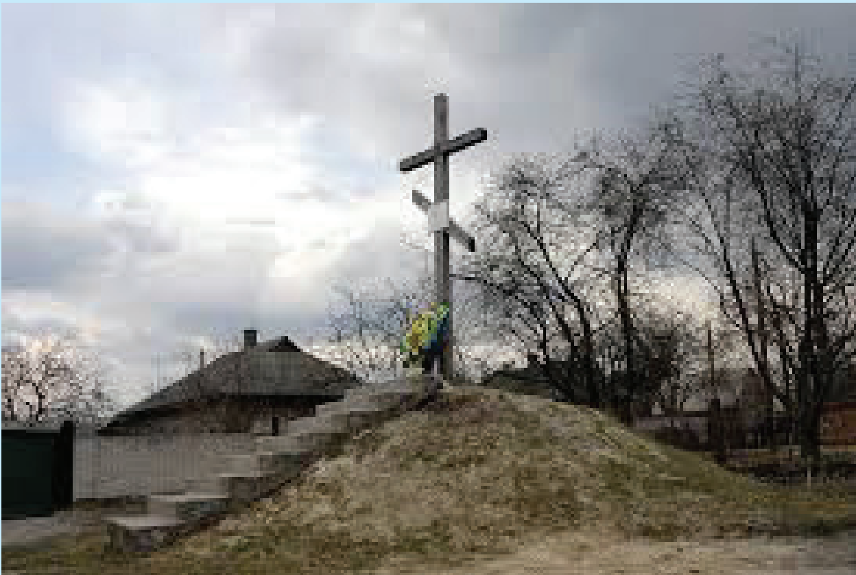
16 Лебедин (Сумська область). Хрест пошанування мазепинців бл. 2007 р.