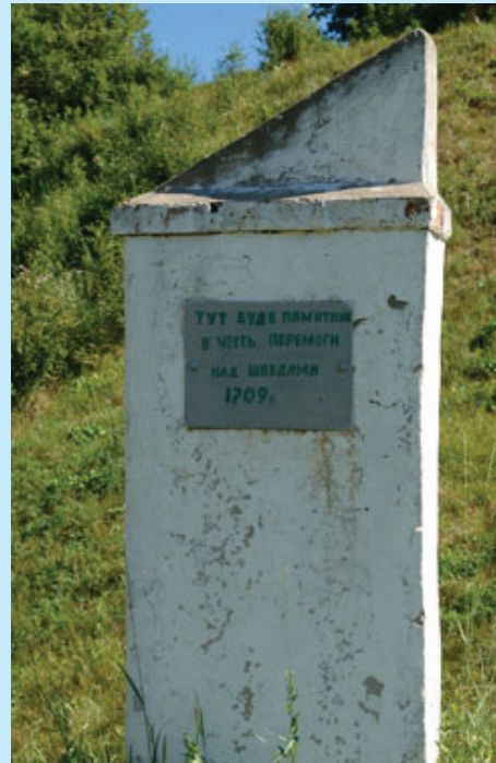
2. Пам'ятний знак в селі Городньому (Краснокутського району, Харківської області). Фото 2005 р.