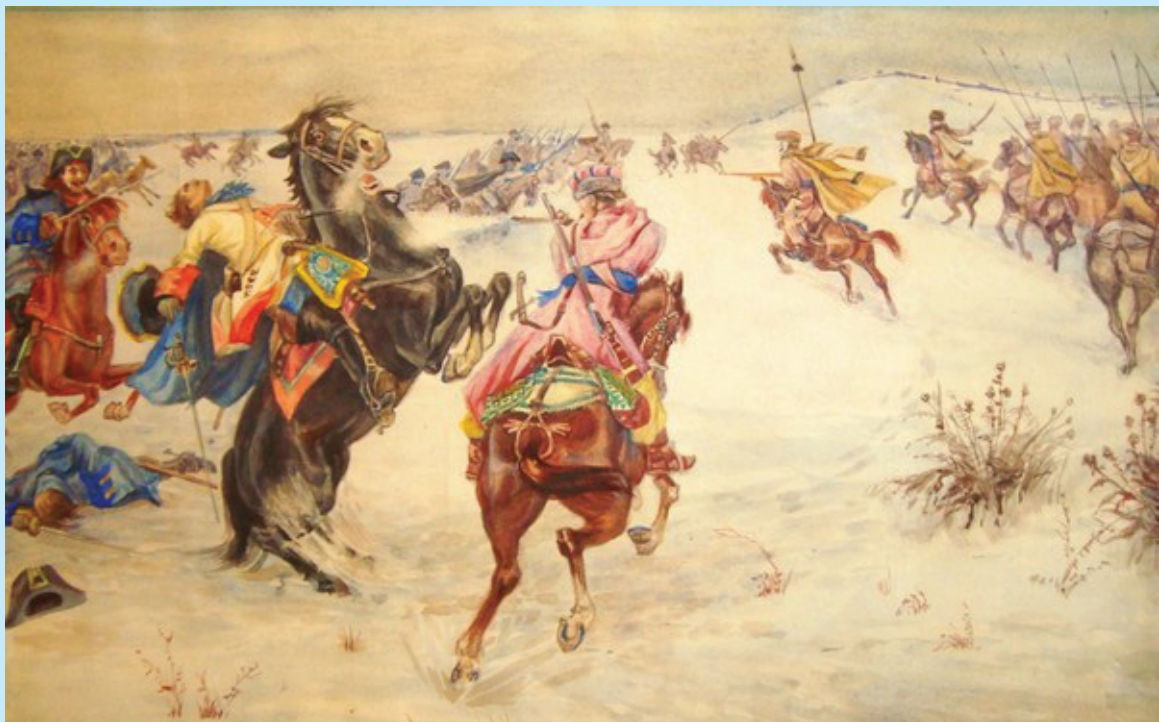
9 Бій козаків Харківського полку зі шведами під Веприком. Художник Дьяченко