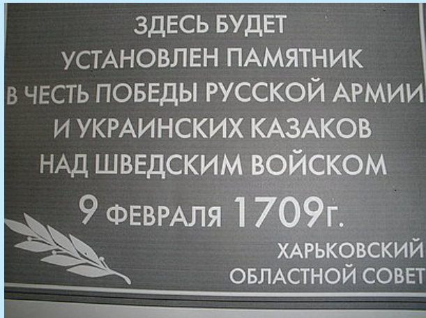
13 Табличка встановлена на стовпчику в Городньому (Краснокутського району, Харківської обл.) представниками Харківської обласної ради у лютому 2009 р.