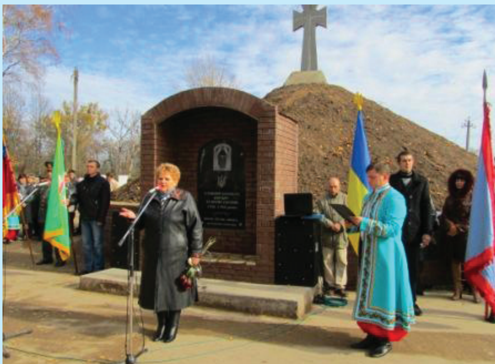
20 Лебедин. Відкриття меморіалу «Козацька могила» 20 жовтня 2013 р.