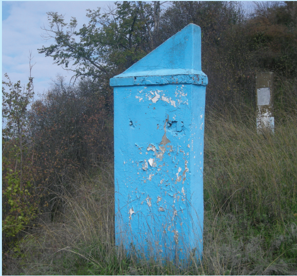
14 Городне. «Місце пам'яті». Сучасний вигляд. Фото 2013 р.