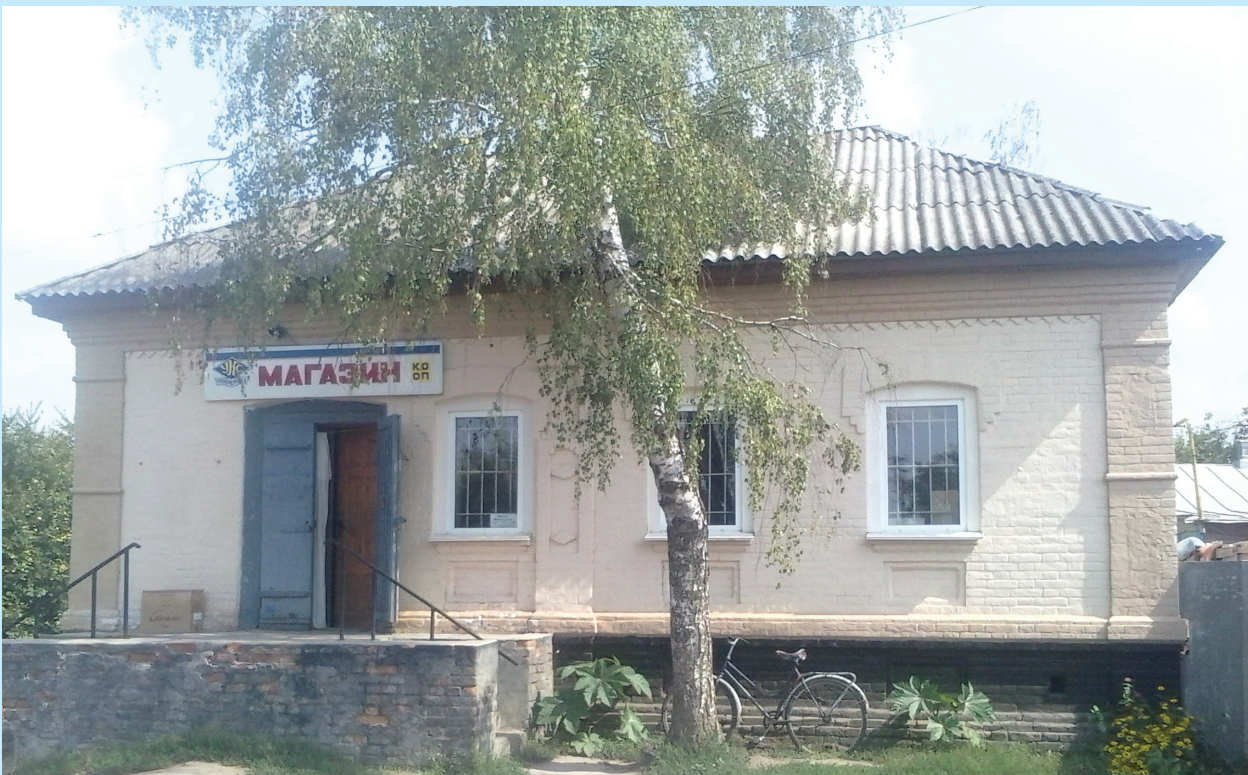
5. Котельва. «Королівський» магазин. Фото 2013 р.