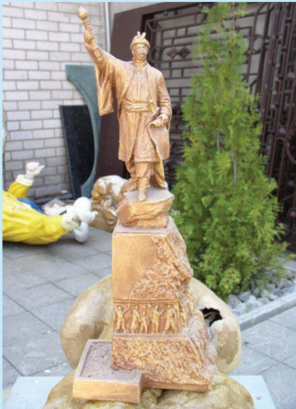
11 Проект пам'ятника Іванові Мазепі в Коломаку. Скульптор Сейфаддін Гурбанов