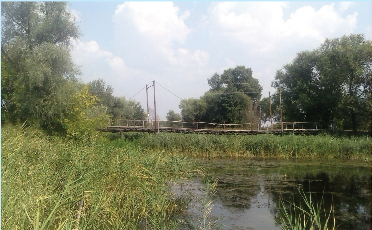
4. Котельва (Полтавська обл.). «Королевський міст». Сучасний вигляд. Фото 2013 р.