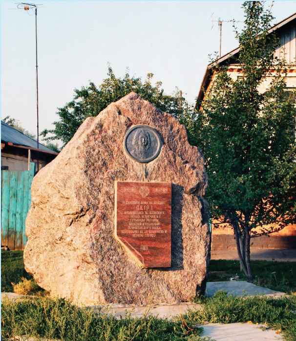
3. Камінь на «місці зустрічі» Петра Першого з Мазепою в Острогозьку 1696 р. (Воронезька обл., Російська федерація). Фото 1997 р.