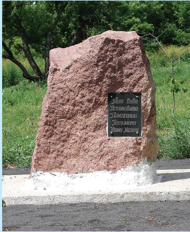
10 Пам'ятний камінь на місці майбутнього встановлення пам'ятника Іванові Мазепі в смт. Коломак 2006 р.