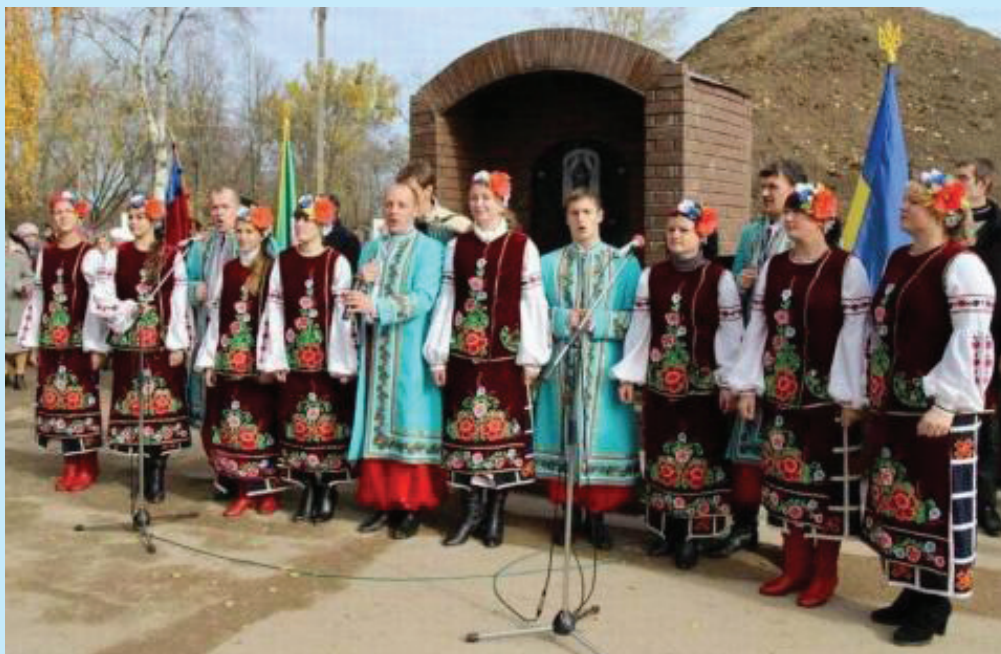
19 Лебедин. Відкриття меморіалу «Козацька могила» 20 жовтня 2013 р.