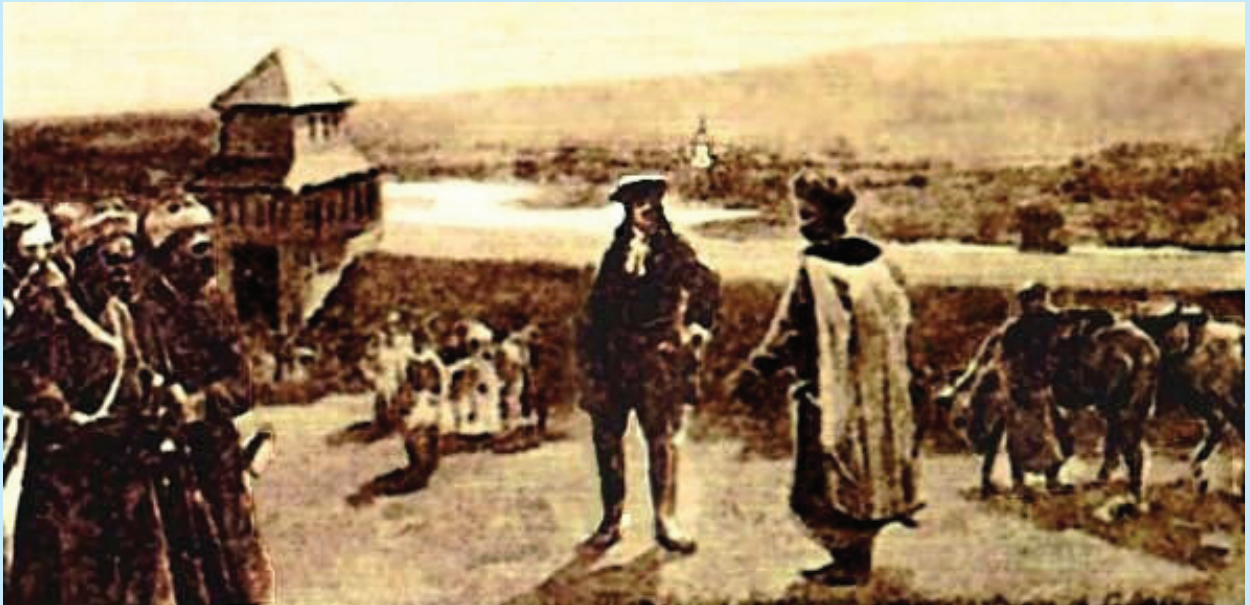
8 Огляд Петром Першим Харківської фортеці. Малюнок Сергія Васильківського поч. XX ст.