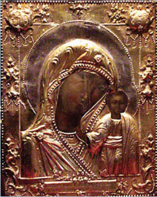
7 Каплунівська ікона Божої матері (1689). Сучасний вигляд