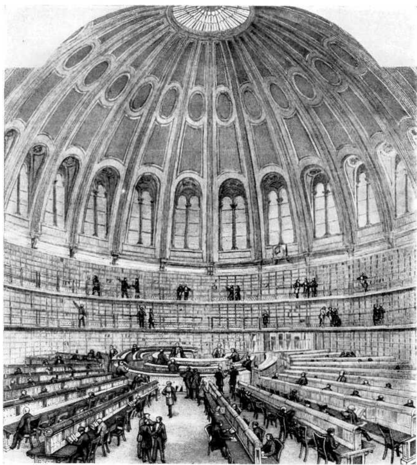
Читальний зал Британського музею в Лондоні, де Маркс працював над «Теоріями додаткової вартості» (З англійської гравюри середини XIX століття)