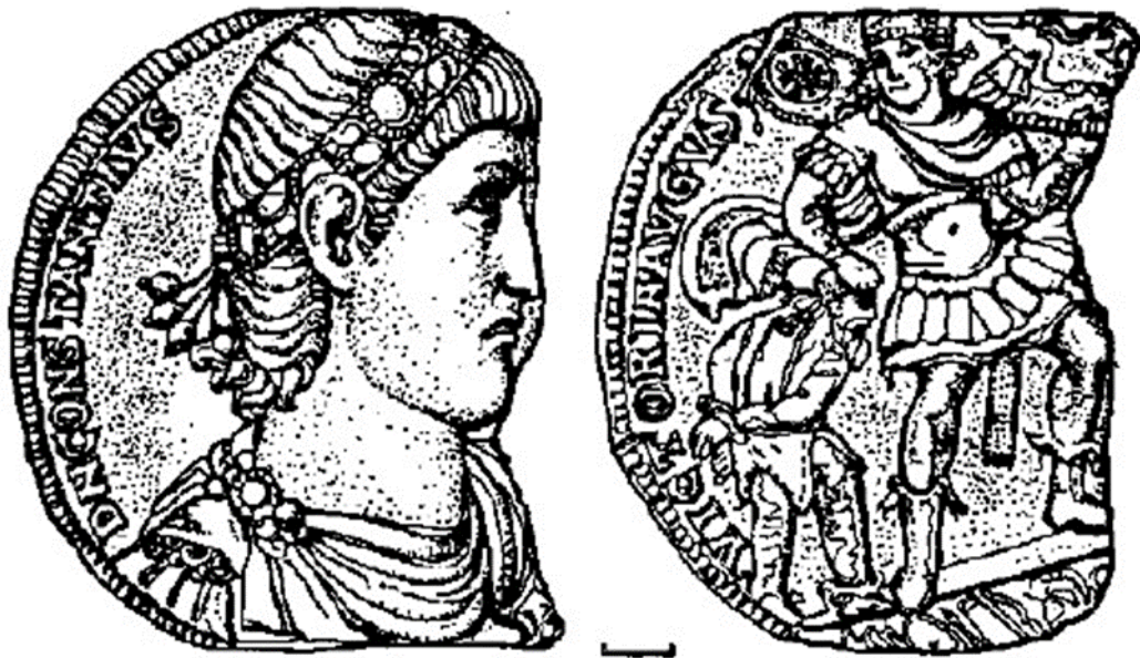
Рис. 3. Золотий медальйон Констанція II з с. Верхівня (за Б. Гарбузом)