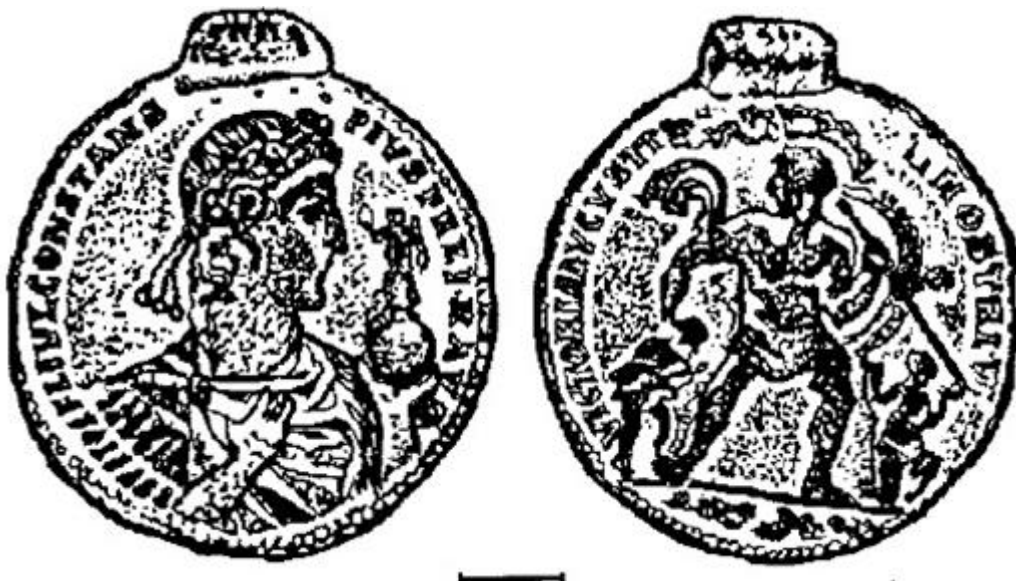
Рис. 4. Золотий медальйон Констанса зі скарбу в Києво-Печерській лаврі