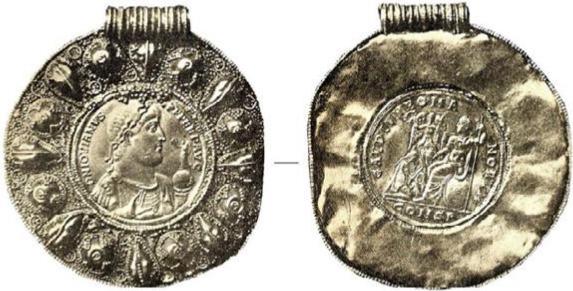
Рис. 2. Медальйон імператора Йовіана з Борочицького скарбу (за Ю. Піотровським)