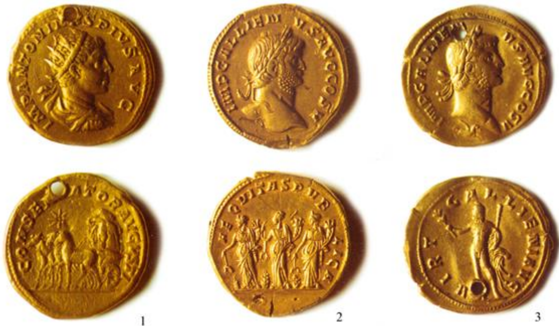
Рис. 5. Римські медальйони: 1 – Елагабал; 2, 3 – Галлен