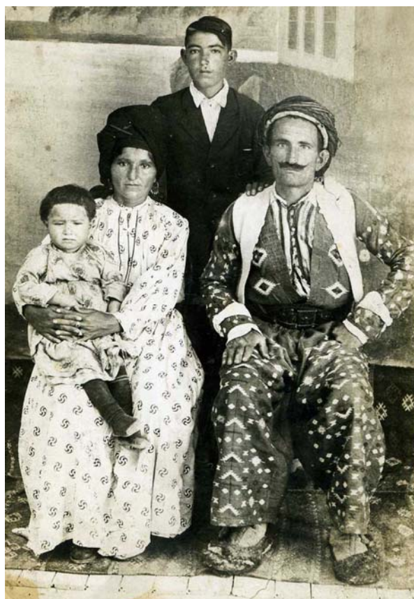
Фото з родинних альбомів