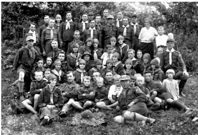
Тучинські пластуни.