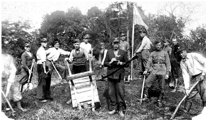
Члени ОУН насипають символічну могилу Борцям за волю України. Тучин, 1941 рік.