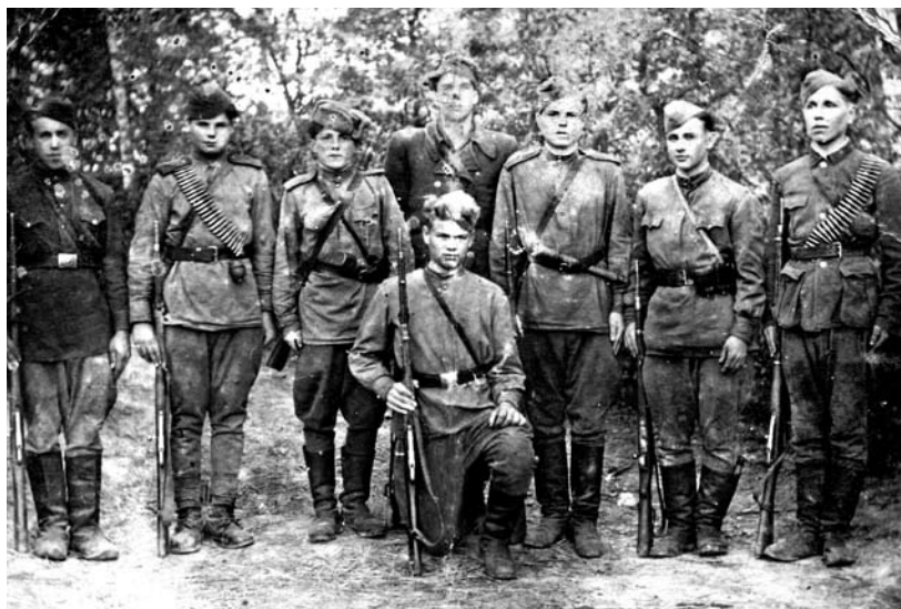
Повстанці з куреня УПА «Недолі»