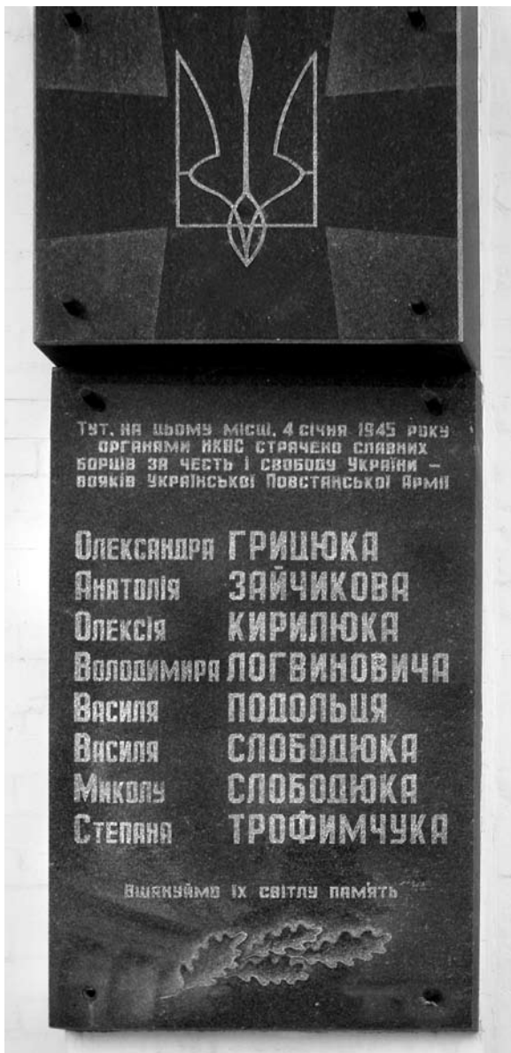
Меморіальна дошка у Рівному поблизу місця страти С. Трофимчука та ще сімох учасників ОУН і УПА