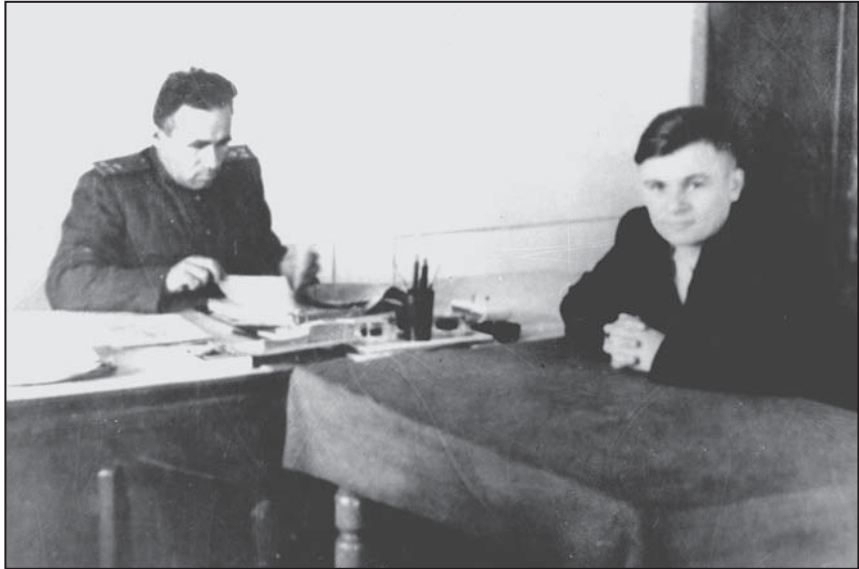
Співробітники УМГБ Тернопільської області Хоросун і Свердлов

‘Чумака’ перед тим відправили в село на «конспіративну квартиру», де його теж роззброїли і захопили, хоча він при затриманні вчинив опір: хотів підірвати всіх гранатою і був поранений. Агенти вилучили у підпільників 21 тисячу карбованців, самозарядну гвинтівку, пістолет ТТ і револьвер системи Наган, блокноти з записами про встановлені дати зв’язків і шифри. Незабаром на місце прибули оперативні працівники з військовою групою, і ‘Орлан’ був відправлений у Київ для допитів 24 .