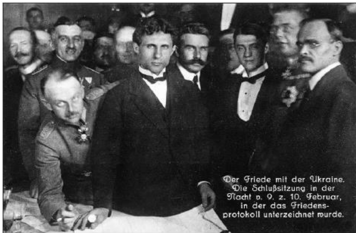
Підписання Брестського миру з Україною. Стоять посередині, зліва направо: генерал Брінкман, Микола Любинський, Микола Левитський, Олександр Севрюк, генерал Гофман, Сергій Остапенко

«Мировий договір між Німеччиною, Туреччиною, Австро-Угорщиною, Болгарією та Українською Народною Республікою