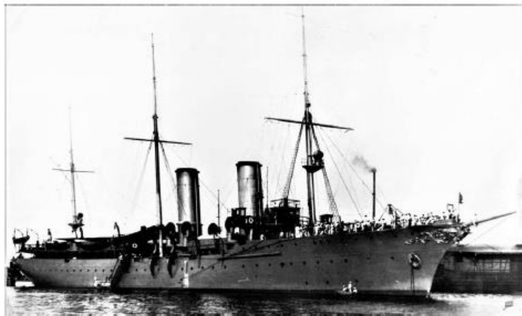
Крейсер 2-го рангу «Алмаз»

мів тоді прорватися повз Японію у Владивосток) тепер став плавучою в'язницею, місцем масових тортур і страт: людей спалювали живцем у корабельній топці або зв'язаними скидали в море. Карт-бланш на застосування насильства отримали й численні озброєні загони анархістів. Як зазначає сучасний історик Віктор Савченко: «От «вооруженных братишек» зависела жизнь и смерть любого одессита, его сбережения. «Забрать и поделить» – суть их экономической политики».