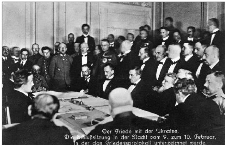
Der Friede mit der Ukraine. Die Schlußsitzung in der Nacht vom 9. zum 10. Februar, in der das Friedensprotokoll unterzeichnet wurde. Підписання Брестського миру з Україною. Сидять посередині, зліва направо: граф Оттокар Чернін (Австрія), Ріхард фон Кюльман (Німеччина), Василь Радославов (Болгарія)

Делегацію очолював голова Центрального виконавчого комітету цього державного утворення Юхим Медведєв. Л. Троцький намагався довести представникам Центральних держав, що саме Ю. Медведєв та його «товариші» мають представляти Україну. Він навіть вдався до відвертої провокації, заявивши 3 лютого, що більшовики захопили Київ, і мати справу з посланцями Центральної Ради тепер не має сенсу. Завдяки вчасно отриманій телеграмі з Києва О. Севрюку вдалося спростувати зухвалу заяву Л. Троцького. Вести переговори з харківськими делегатами так ніхто й не