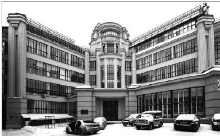
Кузнецовський корпус Московського архітектурного інституту (вулиця Рождественка, 11), де в липні 1918 року відбувся I з'їзд КП(б)У

В резолюції про відносини України та Росії мовилося: «Завданням нашої партії на Україні є... боротися за революційне об'єднання України з Росією на засадах пролетарського централізму в межах Російської Радянської Соціалістичної Республіки, на шляху до утворення всесвітньої пролетарської комуні». Отже, прямим текстом було заявлено про намір приєднати Україну до складу Росії. Хоча ще півроку тому В. Ленін і Л. Троцький, принаймні на словах, визнавали право України цілковито відокремитися від Росії.