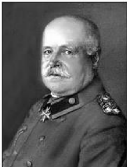
Герман фон Айхгорн