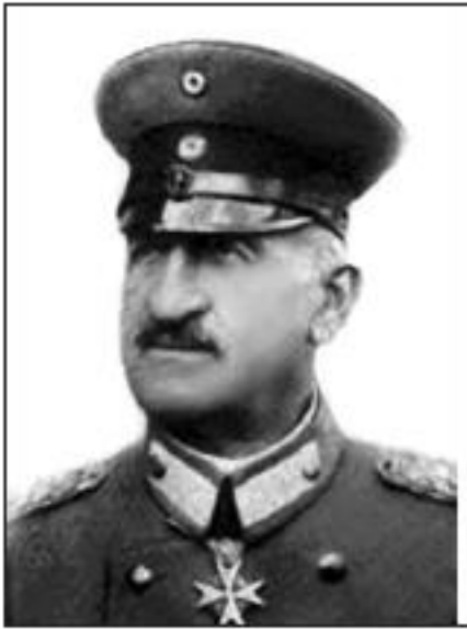
Александр фон Линзінген

Наступного дня ситуацію почали обговорювати на засіданні Малої Ради, де ледь зібралася третина депутатів. Вони хоч і провели жваву дискусію, але жодного конкретного рішення не ухвалили, та обмежилися передачею всіх звернень до спеціальної комісії.