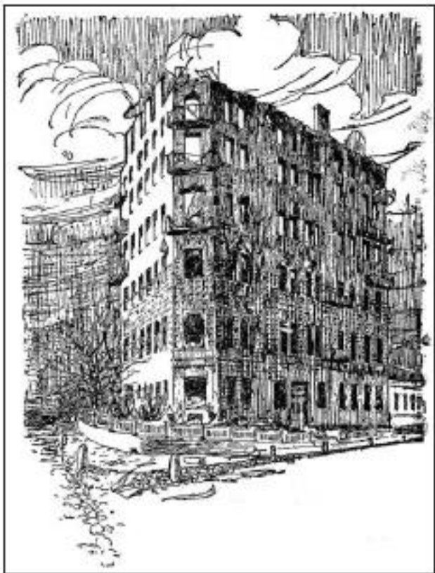
Малюнок зруйнованого дому Михайла Грушевського