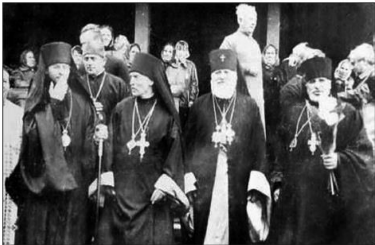
Перша сесія Всеукраїнського православного церковного собору

рального секретарства внутрішніх справ з'явилася посада комісара у справах ісповідань. Ним став товариш (заступник) генерального секретаря Олександр Карпинський, член Української партії соціалістів-федералістів. Хоча в цілому соціалістичне керівництво УНР виявляло досить кволу зацікавленість у церковних справах.