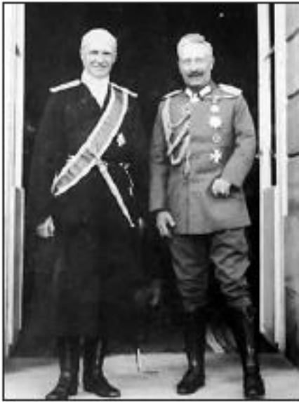
Зустріч Павла Скоропадського і Вільгельма II

Після сніданку Вільгельм II визнав за необхідне поговорити з О. Палтовим і Г. Зеленецьким. Гетьмана в цей час «розважали» нудною розмовою наближені до Кайзера особи його почету. Власне на цьому зустріч і закінчилася.