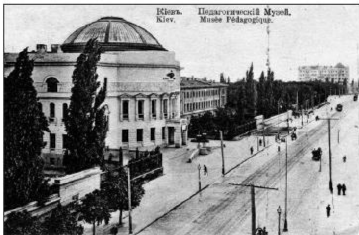
Будинок Української Центральної Ради

ше до початку роботи Всеросійських або Українських Установчих зборів. Проте українську конституанту через початок більшовицької збройної агресії скликати взагалі не вдалося, а російську в Петрограді брутально розігнали більшовики і «втомлений караул» на чолі з анархістом Анатолієм Железняковим, який через півтора роки після того знайшов свою смерть у степах України від білогвардійців.