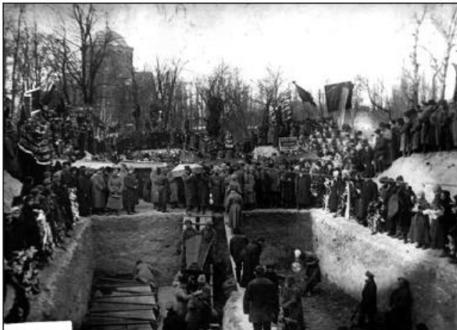
Похорон більшовиків та їхніх прихильників, загиблих у боях проти військ УНР. Київ, Маріїнський парк, 17 лютого 1918 року

Попри заяви уряду УНР про непричетність до вбивства Л. П'ятокова, виявлення його понівеченого тіла спонукало більшовиків та їхніх прихильників до повстання проти Центральної Ради. Трохи пізніше, під час тритижневого панування «червоних» у місті в лютому 1918 року, Л. П'ятокова було поховано у братській могилі в Маріїнському парку. На мітингу, присвяченому його пам'яті, молодший брат Георгій П'ятков пообіцяв помститися «всім ворогам», що, вірогідно, спровокувало чергову хвилю більшовицького терору і позасудових розправ у місті.