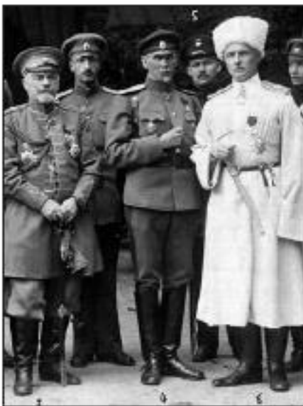
Донський посол Олександр Черячукін (у центрі) на прийомі у Павла Скоропадського. Ліворуч від посла в 1-му ряду — військовий міністр Української Держави Олександр Рогоза

Найбільш результативною стала діяльність посольства генерала О. Черячукіна. Наприкінці серпня після обопільно-