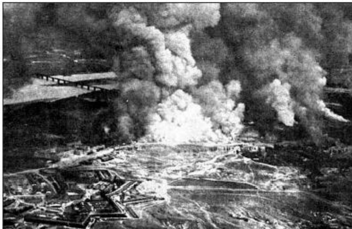
Вибухи на артилерійських складах у Києві 6 червня 1918 року