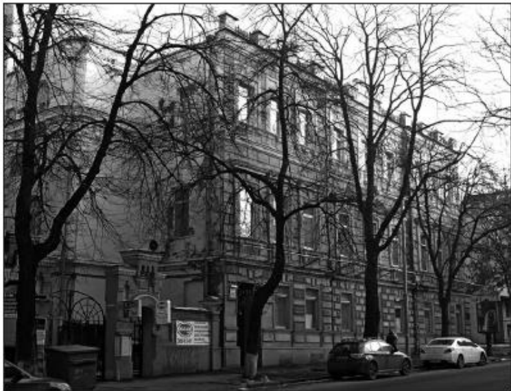
Будинок Українського наукового товариства, де 27 листопада 1918 року відбулося перше засідання Української Академії наук

В. Вернадський назвав останню пропозицію М. Туган-Барановського абсолютно неприйнятною. Він вважав, що це «ставит верховную власть, комиссию и первый состав академиком в крайне трудное положение, лишая первую инициативы и создавая для комиссии и первых академиком возможности упреков в заинтересованности, ибо надо думать, что в числе лиц, рекомендованных комиссией, будут также