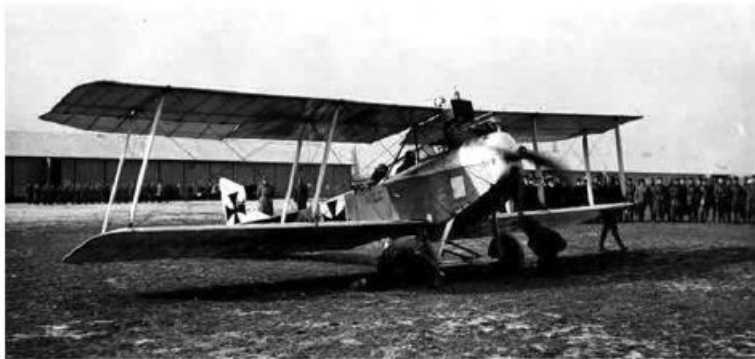
Перший старт авіапошти Відень—Київ 20 березня 1918 року

ли здійснюватися регулярно, у звичайному робочому режимі. Коли світловий день став довшим, літаки почали стартувати о 5.30, а о сьомій вечора вже завершували переліт в кінцевому пункті призначення. Рейси виконували щоденно, за розкладом, який авіатори прагнули педантично витримувати. І загалом це їм вдавалося, попри технічну недосконалість літаків того часу та примхи погоди. Так, за перші 90 днів роботи лінії 80 рейсів було виконано у повній відповідності до розкладу, і лише у десятиох випадках літаки запізнилися через погану погоду.