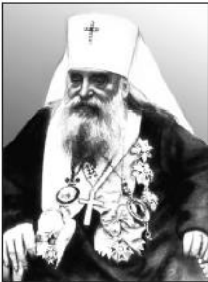
Антоній (Храповицький), митрополит Київський і Галицький

мають утримуватися за державні кошти УНР.