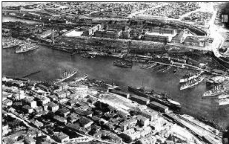
Кораблі Чорноморського флоту в Севастополі, 1918 рік

До Києва із Севастополя полетіла телеграма: «Сего числа Севастопольская крепость и флот, находящийся в Севастополе, подняли украинские флаги. В командование вступил адмирал Саблин».