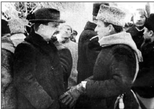
В. Винниченко і С. Петлюра під час урочистого вступу Директорії до Києва 19 грудня 1918 року

ни українського народу. Центром святкувань стала Софійська площа, де відбувся військовий парад – традиційний захід для всіх політичних режимів, під контролем яких опинявся Київ у 1917–1921 роках. Присутнім був й іноземний дипломатичний корпус.