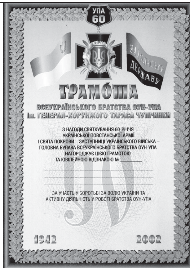
3. Грамота з нагоди святкування 60-річчя УПА, де вказуються номер відзнаки, ім'я та прізвище нагородженого.