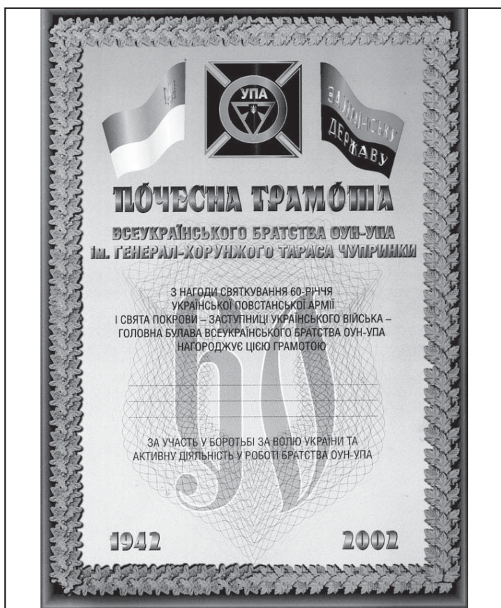
4. Почесна грамота з нагоди святкування 60-річчя УПА за участь у боротьбі за волю України та активну діяльність у роботі братства ОУН-УПА.

Треба зауважити, що ця відзнака була випущена згідно з розпорядженням голови Львів-