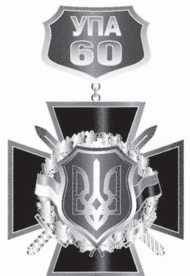
1. Варіанти ювілейної відзнаки, присвяченої 60-річчю створення УПА, розроблені Володимиром Турецьким.