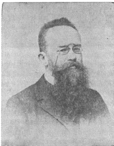
1866 — 1934

українського народа”, в 1904 р., то хребет російської історіософії що-до України було зломлено. Грушевський відібрав від Росії весь князівсько-київський період історії (і те, що було до нього) і „воз’єднав”, як тепер висловлюються в підсоветській літературі, з Україною. З цим передові російські учені перед революцією, як і світова наука, погодилися, бо це була і є історична правда. Дарма, що комуністичні диктатори з Москви тепер знову повертають стару шовіністичну псевдо-теорію, яка каже, ніби у старий київський період була „спільна Русь”, але правда Грушевського непереможна.