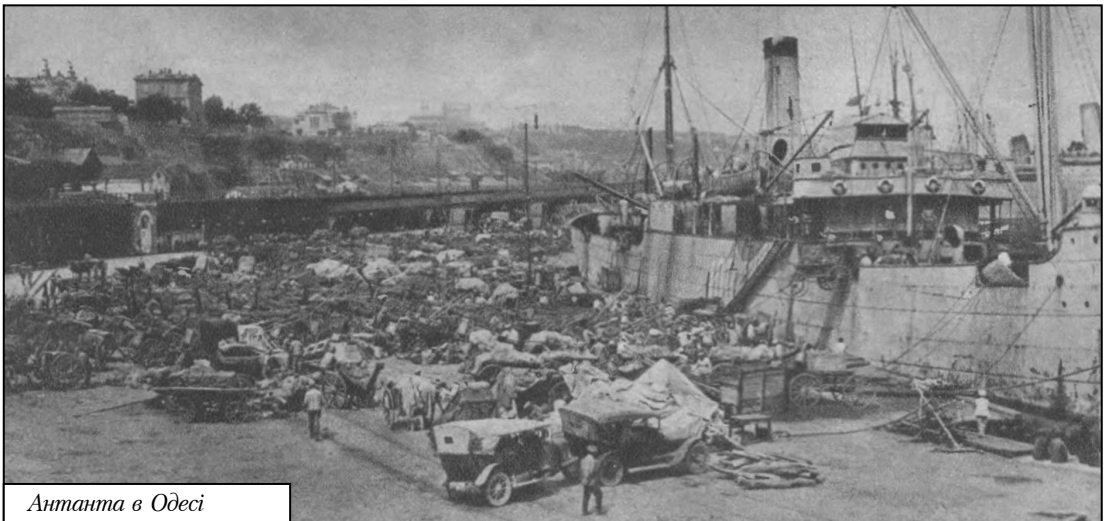
Антанта в Одесі

Якби українська дипломатія на той час боролася за національні інтереси і домагалася гарантій незалежності Української Держави, то наявність потужного і боєготового національного флоту в портах України була б найкращим аргументом в переговорах з командуванням сил Антанти – вона не