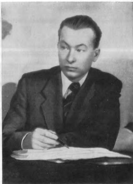
А. С. Малишко. Фото 30-х років.