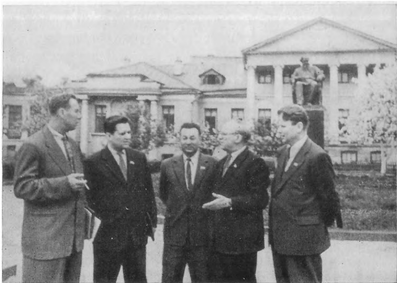
Леонід Новиченко, Олесь Гончар, Андрій Малишко, Пятрусь Бровка, Максим Танк. Фото 60-х років.