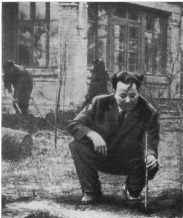
Малшко садить гілочку Тарасової верби, привезеної з Кос-Аралу. Фото 60-х років.