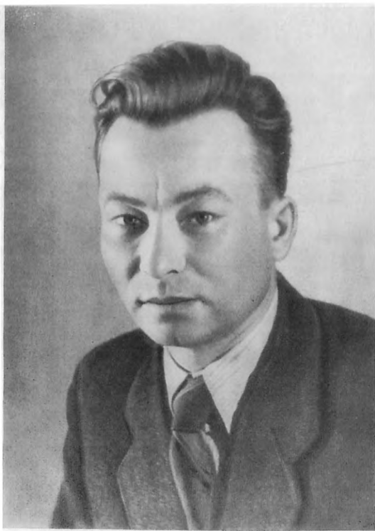
А. Малишко, Фото 40-х гг.