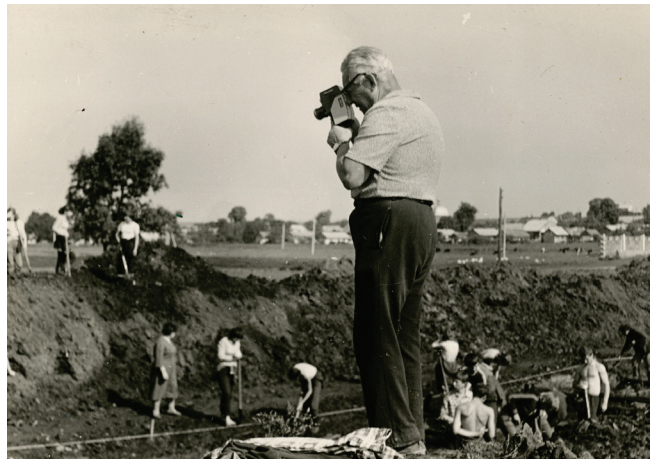
1962 рік. Розкопки у с. Городок (Рівненська область)