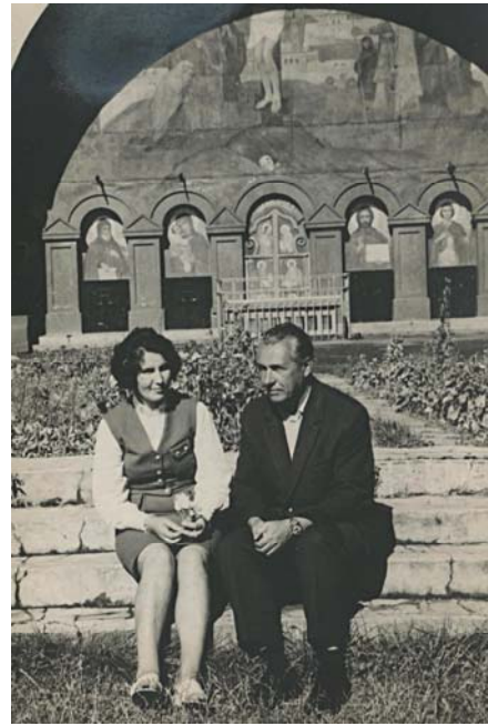
1974 рік. «Козацькі могили»