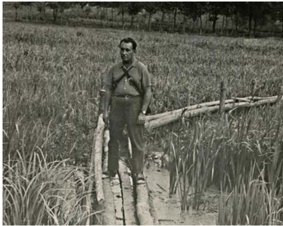
1975 рік. с. Війниця (Рівненська область)