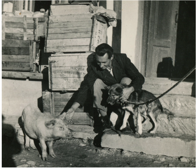
1952 рік. Солончени (Молдавія)