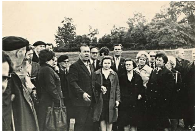
1977 рік. Археологічна конференція у с. Острів (Рівненська область)