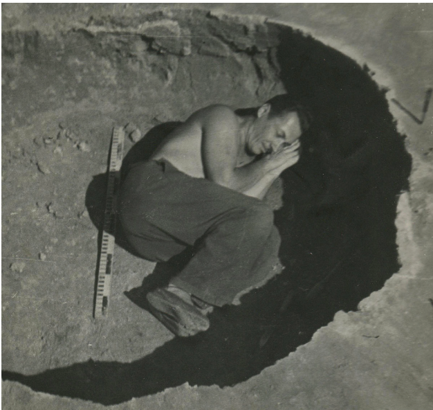
1954 рік. Голеркани (Молдавія)