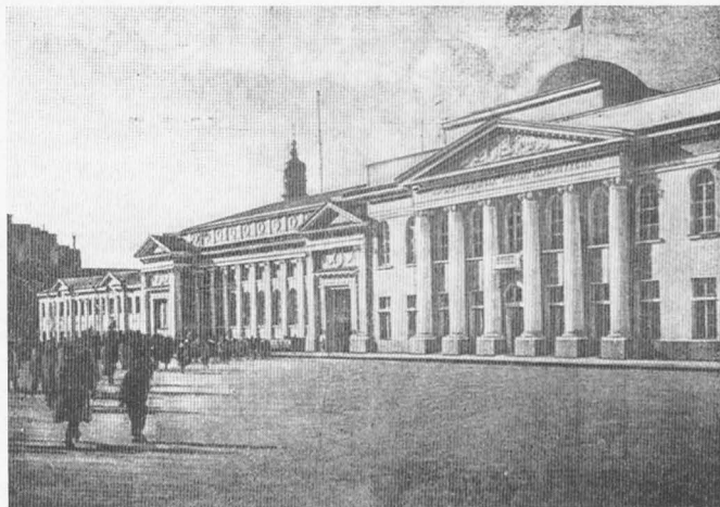
Приміщення ВУЦВК на площі Тевелева в м. Харкові (зруйновано у 1943 р.)

У липні 1936 р. органи прокуратури були виділені із системи Народних Комісаріатів Юстиції союзних та автономних республік, підпорядковані безпосередньо Прокуророві Союзу РСР.