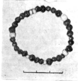
Рис. 2. Намистини з поховання.

Тілопокладення в простих ґрунтових ямах та південно-східна орієнтація поховань характерні для інших сарматських могильників Північ-