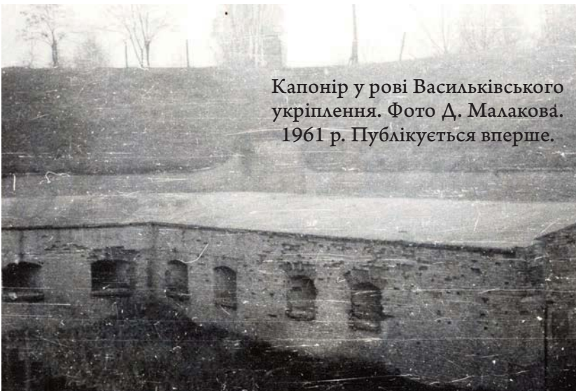
Капонір у рові Васильківського укріплення. 1961 р. Публікується вперше.