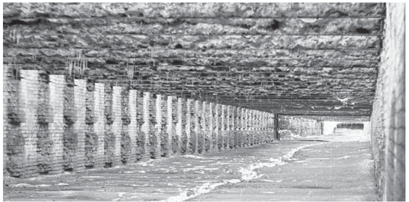
Стрільцький тир на Печерську всередині. 1969 р.