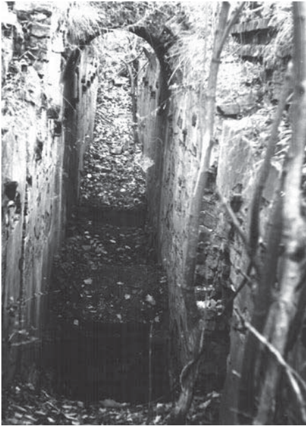
Рештки підвалин Набережного верку. 1969 р. Публікується вперше.