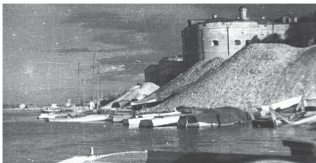
Човновий причал біля Подільських воріт. Фото 1950 р.

Завод розбудовувався, зводились нові корпуси, щезали старі віджилі споруди. Отак на моїх очах 1967 року зламали мало кому тепер відому четверту фортифікаційну споруду, що опинилася в межах заводу «Арсенал». То був одноповерховий казематований верк, який стояв на узвишші на розі Кловського узвозу і теперішньої вулиці Гусовського (при мені – генерального директора заводу «Арсенал»). Заносити на територію заводу фотоапарат та й ще фотографувати – означало звинувачення в шпигунстві з усіма суворими наслідками, а «мобілок» тоді не існувало. Отож, збереглися лише спогади та кілька слів у нотатнику про об'єкт тої руйнації. Не маючи рулетки та й права на такі роботи, «метровими» кроками встановив розмір: 39х9 метрів. У плані – паралелограм з непрямыми кутами, обернутий широким фронтом у бік Кловського узвозу, а колись – просто розлого яру – долини струмка Клов. Коли я побачив той верк, половини вже