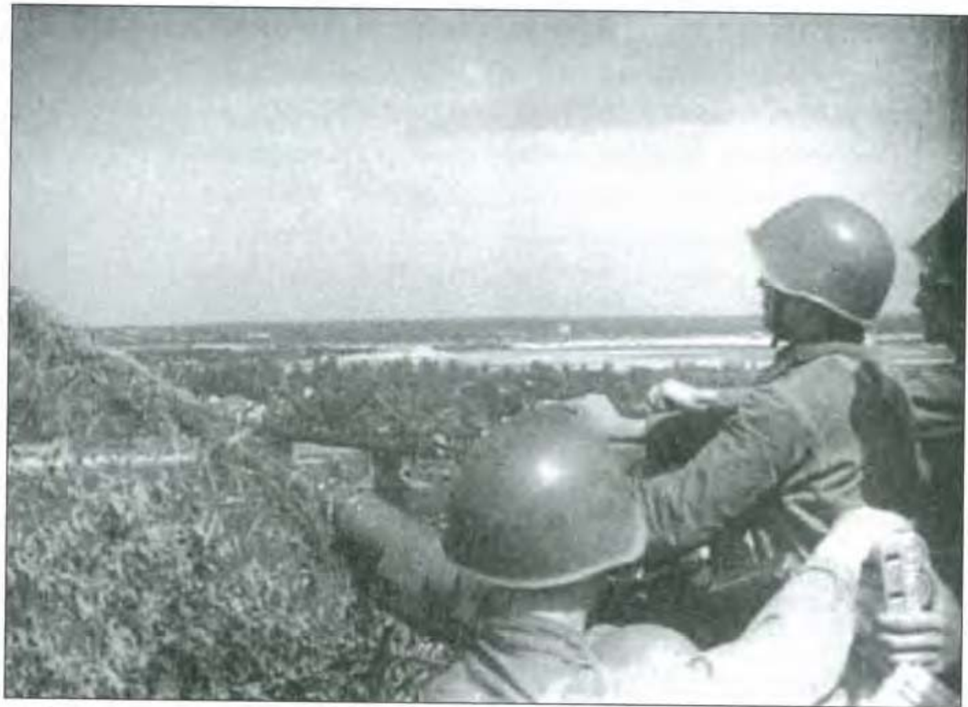
Зенітники пильнують повітряний простір над мостом ім. Є. Бош у Києві. 1941 р.