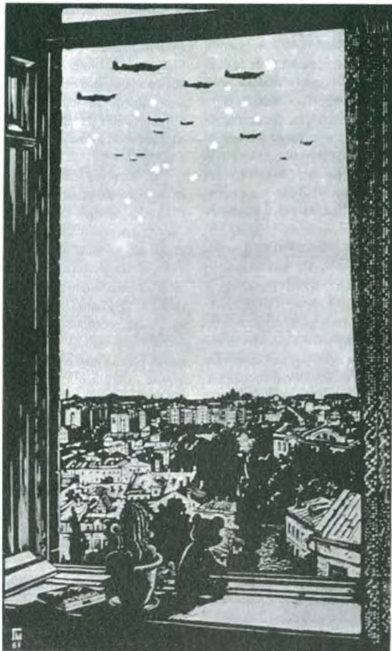
Г. Малаков. Ранок 22 червня 1941 р. Із серії „Київ. 1941 – 1945”. Кольорова ліногравюра. 1961 р.