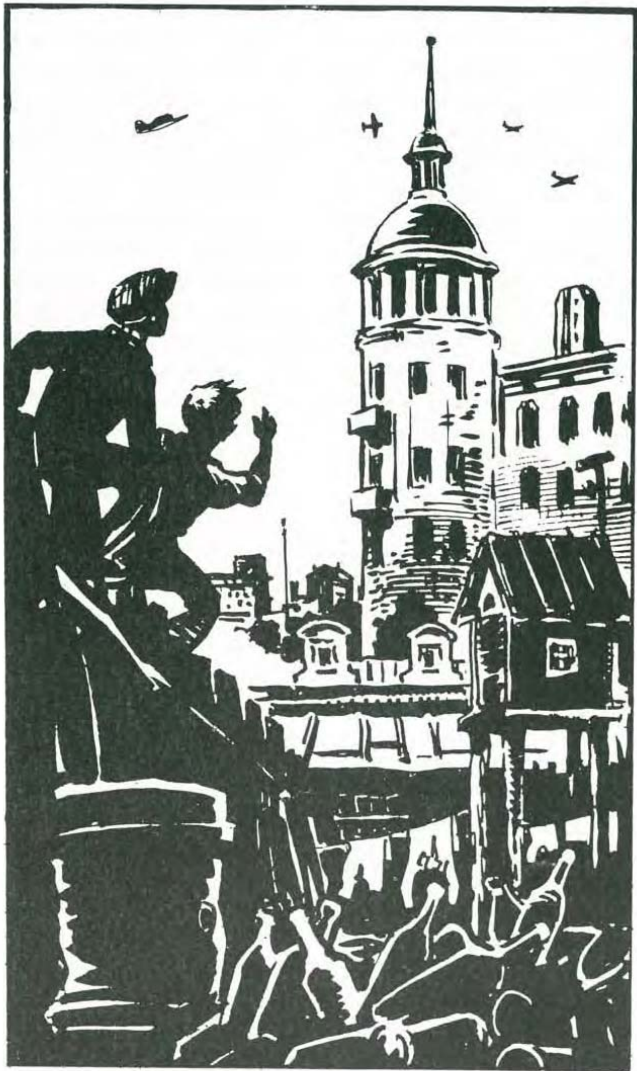
Г. Малаков. Повітряні бої над Києвом. Туш. 1961 р.