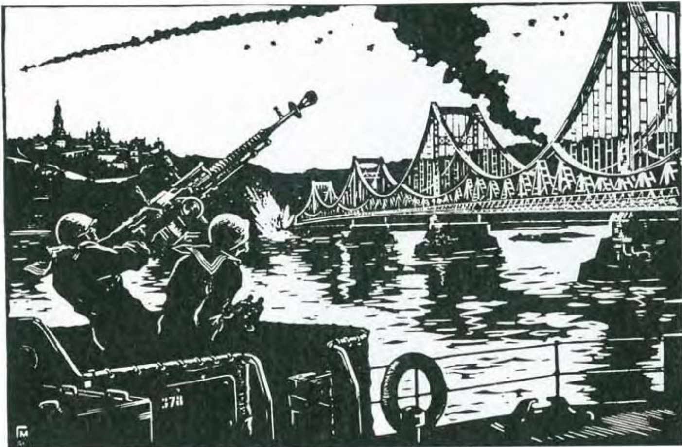
Г. Малаков. Не підпустимо! Із серії „Київ. 1941–1945” Кольорова ліногравюра

Москва була Москвою, де, на думку москвичів, тільки й відбувається щось серйозне, а всі інші – викручуйтесь, як можете” 20 .