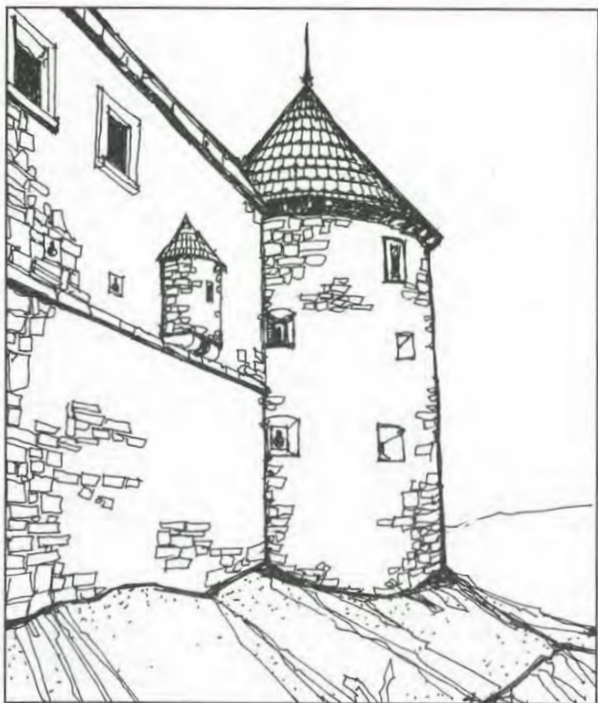
Кругла башта. Проект реставрації