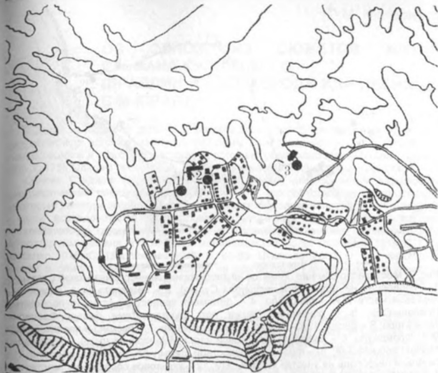
Рис. 2. Месторасположение памятников на посаде раннесредневековой Сугдеи. 1 – некрополь Судаки-VI; 2 – некрополь судак-VII; 3 – некрополь Судаки-IX.