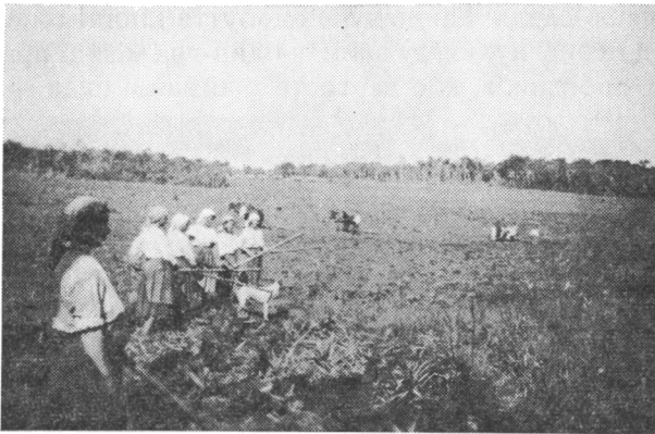
Волинянки з під Почаїва в Парагваю розбивають сапами розорану цілину для посіву рижу на мокляку. В даліні три пари коней боронують на сухшому полі землю перед посівом. На задньому плані тимчасові бараки.

Гіркі й тяжкі були перші початки господарювання українських поселенців у Парагваю. Більшість наших во-