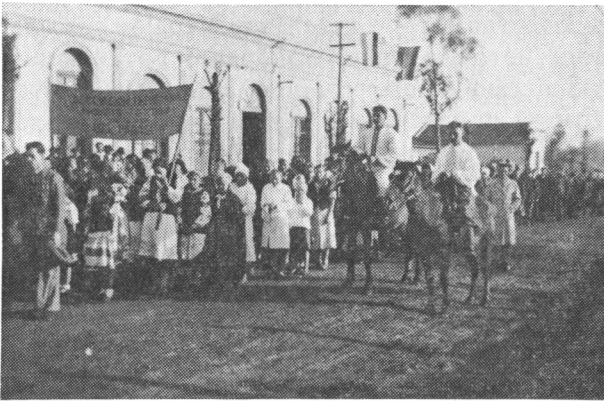
В святочні діні наші поселенці (90% волинян) майже всі належать до Централі Просвіти в Енкарнасіон-і, Парагвай, влаштовують парадні свята. На фото похід до трибуни перед Просвітою.

Повний брак інтелектуальних сил цілком унеможливує поправити справи. А крім цього, під впливом комуністичної пропаганди, багато наших несвідомих волинян, пореєструвались на советських громадян, позбувшись за безцін тяжкою працею здобуті свої господарства, нишком