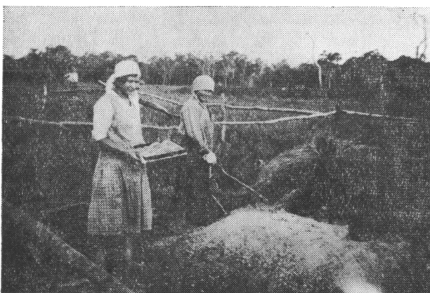
На колонії Фрам на Уру, Парагвай, дві волинянки печуть пироги в запаленому муравлиську, поки буде зроблена піч. Фото Я. Лавриченка.

ки з-під лісу, початково наша праця полягала в тому, що найперше спеціальними шаблями - мачетами підсікалось кущі й тонші дерева, потім сокирами й пилами звалювалось решту грубої деревини. У цей спосіб звалений ліс, при добрій погоді, мусів пролежати 4—5 тижнів, доки не просохне. Пізніше, одного сухого погідного дня це все підпалювалось, тоді весь чагарник і дрібний хмиз, гілля згоряло, зіставались тільки грубезні пеньки і колоддя, що їх згодом, уже роками, спалювалось, решта гнило, трухлявіло. Таким чином, по кількох роках, утворювалось чисте поле, яке можна було обробляти й плугами. Але першу сівбу, чи посадку хліборобських рослин, тут dokonується зараз же по спаленню ліса поміж пеньками й колодами, звичайно за поміччю сапки. Процедура здобуття площі одного гектара під першу культуру займає один-два місяці праці двох добрих робітників, або вартости найманої сили — 40—60 долярів.