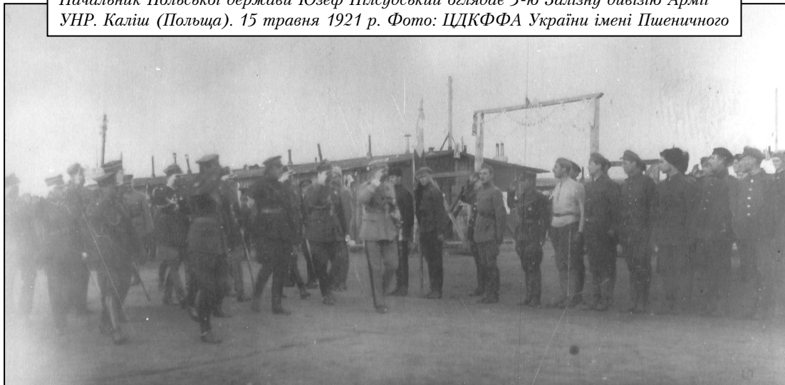
Начальник Польської держави Юзеф Пілсудський оглядає 3-ю Залізну дивізію Армії УНР. Каліш (Польща). 15 травня 1921 р.

Максимальне піднесення партизансько-повстанський рух мав на півночі Поділля, на Волині та Київщині. Саме на ці регіони скеровувалась головна увага ППШ. Сюди