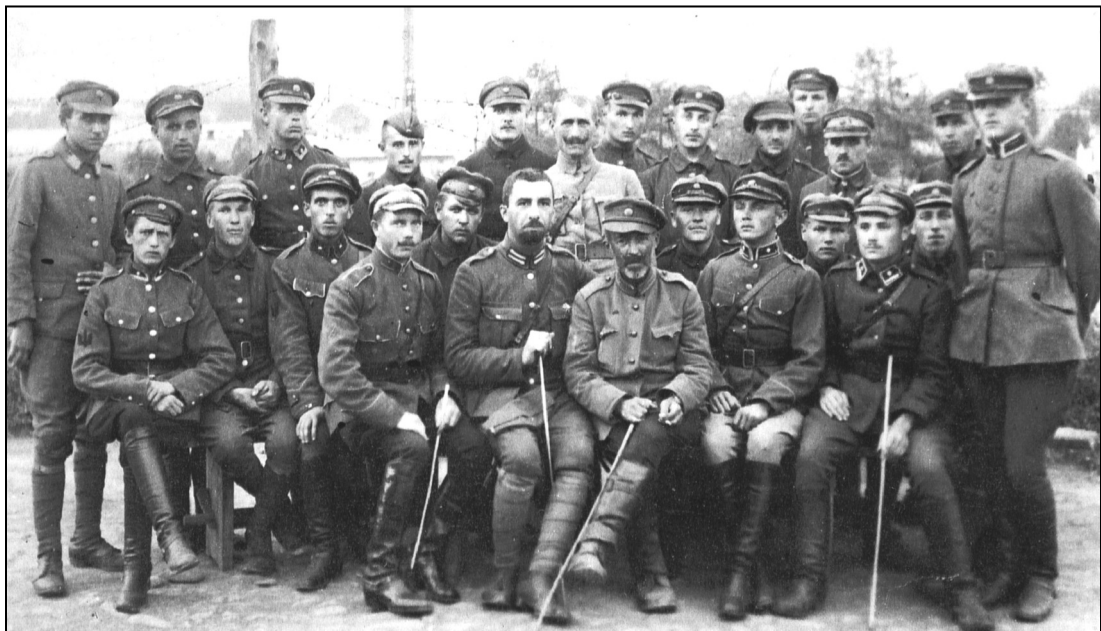
Старшини Кінного дивізіону Армії УНР. Вадовіце (Польща), 12 вересня 1921 р.

Втрачався час найвищого піднесення партизанського руху в Україні, яке припадало на липень 1921 року. За даними ППШ в цей час нараховувалось 42 великих партизанських загони. Серед них виділялися: загін Заболотного (район дій Ольвіополь – Балта), чисельністю – до 6000 багнетів і шабель, 6–8 гармат, кулемети; загін Струка (Коростень – Житомир – Козятин), до 3000 осіб; загін Брови (Новомосковськ – Павлоград), 3000 багнетів, 1000 шабель, 27 кулеметів, гармати; загін Мордалевича (Радомишльський повіт), до 1220 багнетів; формування Бондарчука, Завгороднього і Хмари (Черкащина), до 1200 багнетів; загін Удовиченка (Полтавщина), до 1000 багнетів; «Надбузька Повстанська дивізія» (Гайсинський і Уманський повіти), до 4000 багнетів і