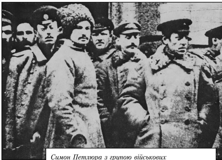
Симон Петлюра з групою військових

розпорядження командування Українського фронту. Він вимагав, щоб війська Українського фронту підкорялись лише наказам, які виходять від Генерального військового секретарства. Заходами Генерального Секретаріату і С. Петлюри у розпорядження УЦР переходять надійні військові частини, зміцнюється керівництво українізованими військовими частинами, видається низка наказів про повну українізацію корпусів і дивізій, управлінь та установ.