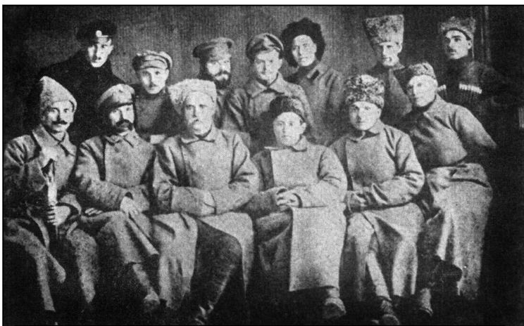
Штаб Гайдамацького коша

С. Петлюра віддав цілу низку наказів про розформування російських частин, причому, українців направляти для укомплектування українських частин, а вояків інших національностей – для формування національних частин, зокрема мусульманських [25, 33–36]. Цей захід дав кадри для створення доволі численних національних частин.