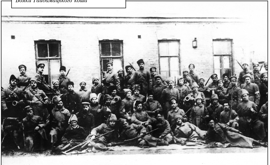
Вояки Гайдамацького коша

Незважаючи на загрозу більшовицької окупації України, 3 січня 1918 року Цент-