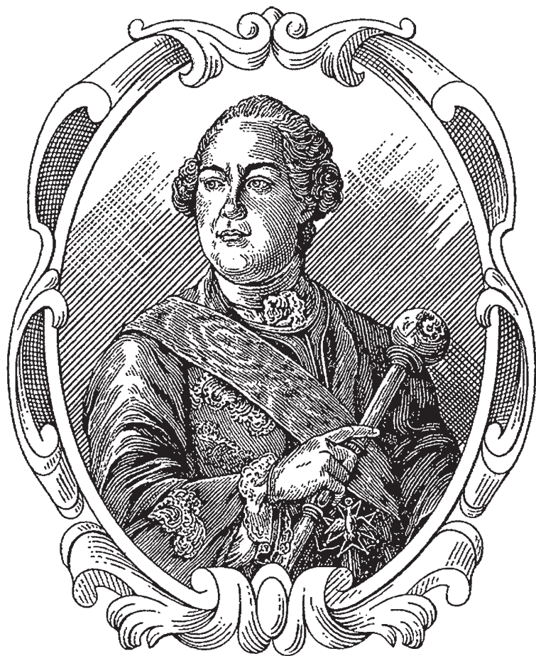
Гетьман Кирило Григорович Розумовський