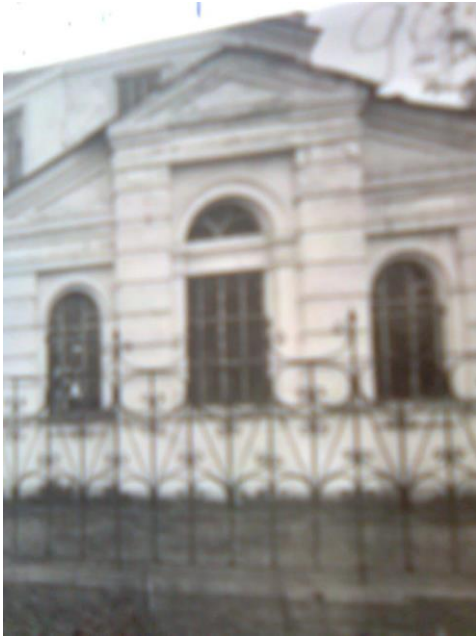
Будівля колишньої Великочернігівської церкви, яка використовувалася під клуб, Верхньотепловський район, Ворошиловградська область, 1951 р.