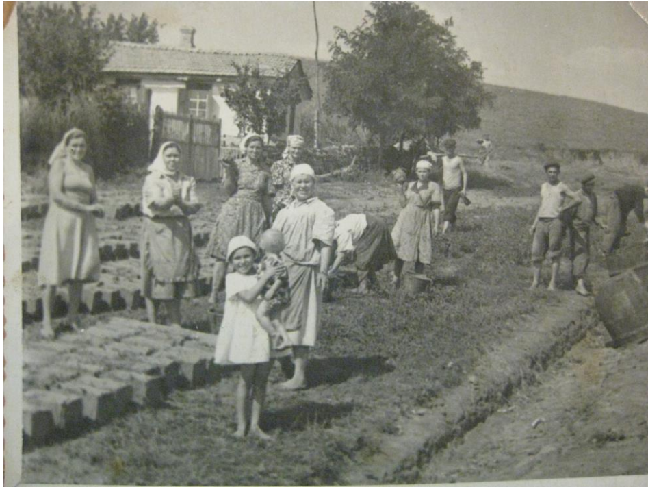
Толока (хутір Новопетрівка, Амвросіївський район, Донецька область, 1965 р.)