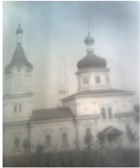
Церква в селі Слобода Вербка, Чечельницький район, Вінницька область, 1951 р. (ЦДАВО України. — Ф. 4648. — Оп. 1. — Спр. 68. — Арк. 101.)