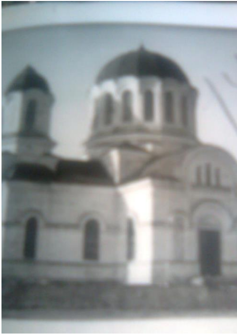
Церква в селі Любомирівка Березнегуватський район, Миколаївська область, 1952 р.