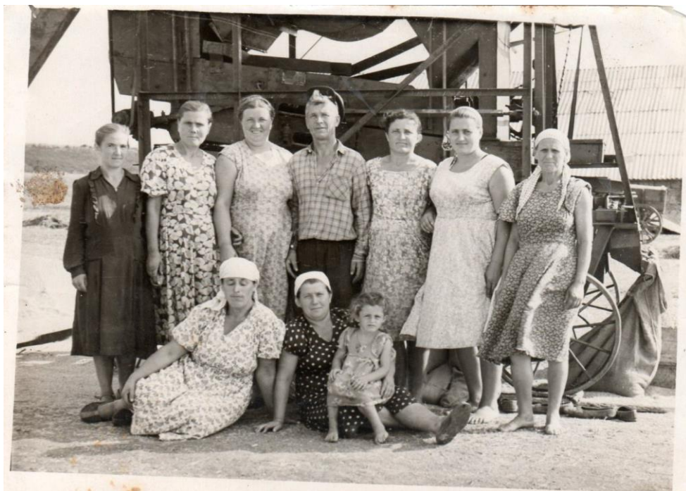
Бригада з очищення зерна на фоні сільськогосподарської машини «Віялка» (село Розсипне, Торезький район, Донецька область, 1957 р.)