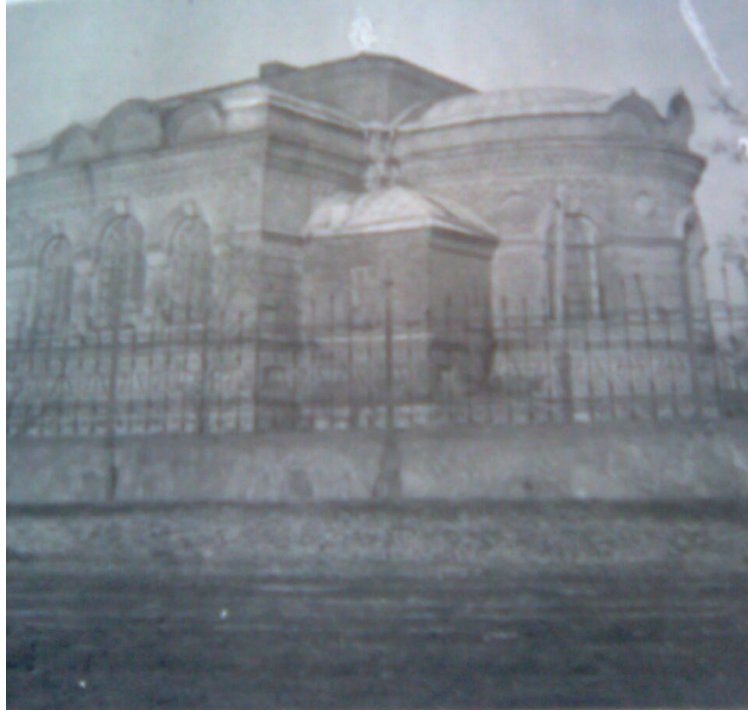
Будинок церкви, переобладнаний під клуб, село Сурсько-Литовське, Дніпропетровська область, 1951 р. (ЦДАВО України. — Ф. 648. — Оп. 1. — Спр. 69. — Арк. 200.)