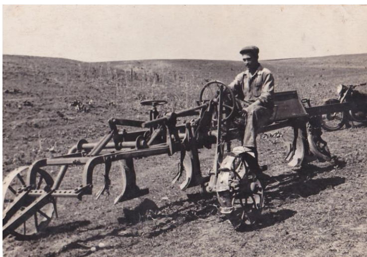
Перший день роботи після закінчення училища (колгосп «Нива», Тельманівський район, Донецька область, липень 1964 р.)