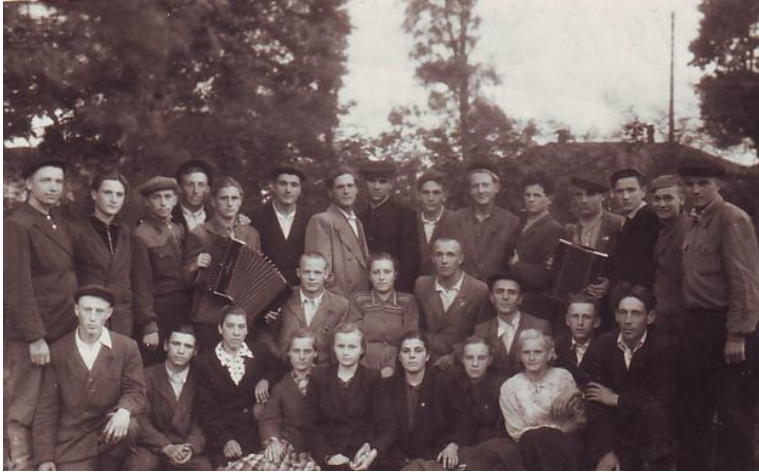
Колективне фото сільської молоді. Проводи до армії (хутір Сатурин, Деражнянський район, Хмельницька область, 1955 р.)