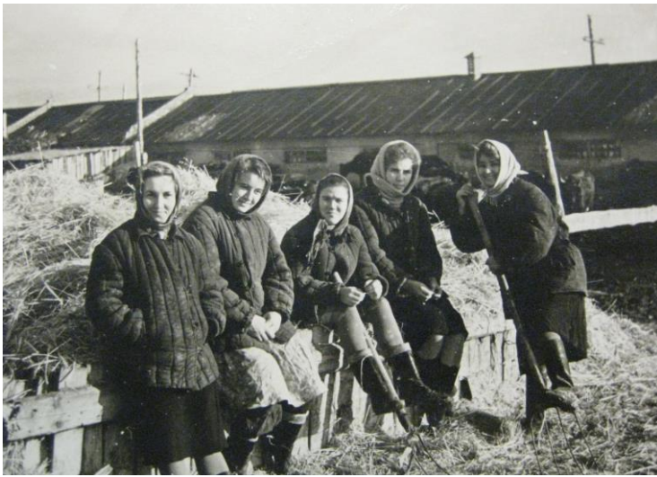
На колгоспній фермі (хутір Новопетрівка, Амвросіївський район, Донецька область, 1961 р.)