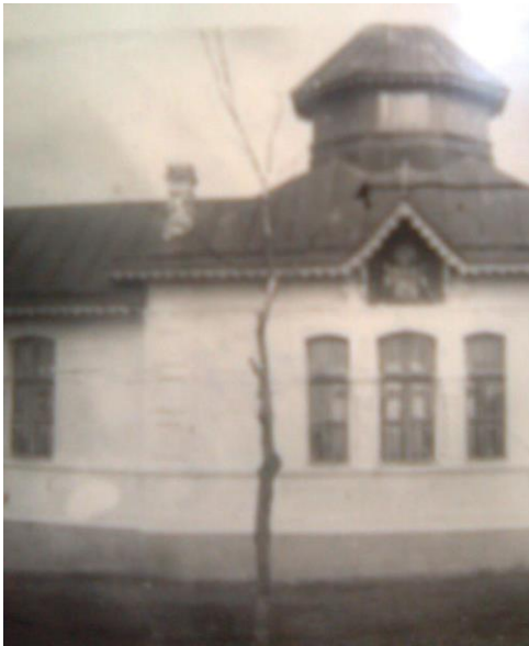
Молитовний будинок в селі Рибальче, Херсонська область, 1951 р. (ЦДАВО України. — Ф. 4648. — Оп. 1. — Спр. 74. — Арк. 200.)