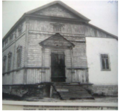
Будівля колишньої церкви, переобладнана під сільський клуб в селі Іванівка, Охтирський район, Сумська область, 1951 р. (ЦДАВО України. — Ф. 4648. — Оп. 1. — Спр. 73. — Арк. 280.)