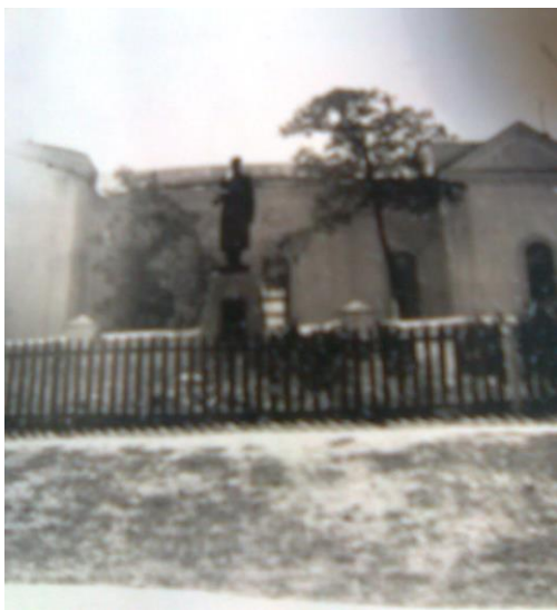
Будівля колишньої церкви, переобладнана під клуб село Макарів Яр, Ворошиловградська область, 1951 р., (ЦДАВО України. — Ф. 4648. — Оп. 1. — Спр. 69. — Арк. 108—111.)