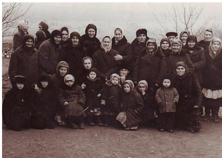
Колективне фото селян (село Лісне, Покровський район, Дніпропетровська область, 1963 р.)