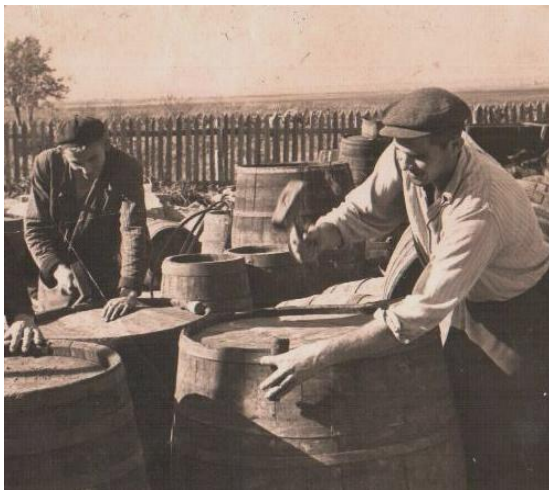
Робота бондаря у колгоспному дворі (село Білосарайка, Першотравневий район, Донецька область, 1962 р.)