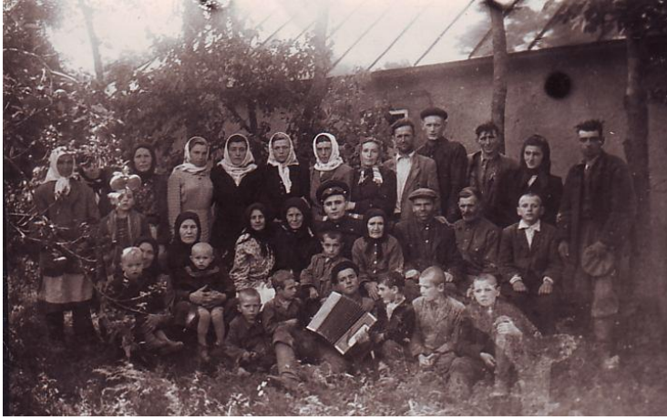
Колективне фото під час відпустки з армії (хутір Сатурин, Деражнянський район, Хмельницька область, 1958 р.)