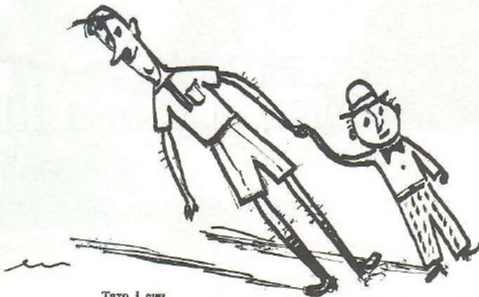
Тато і син