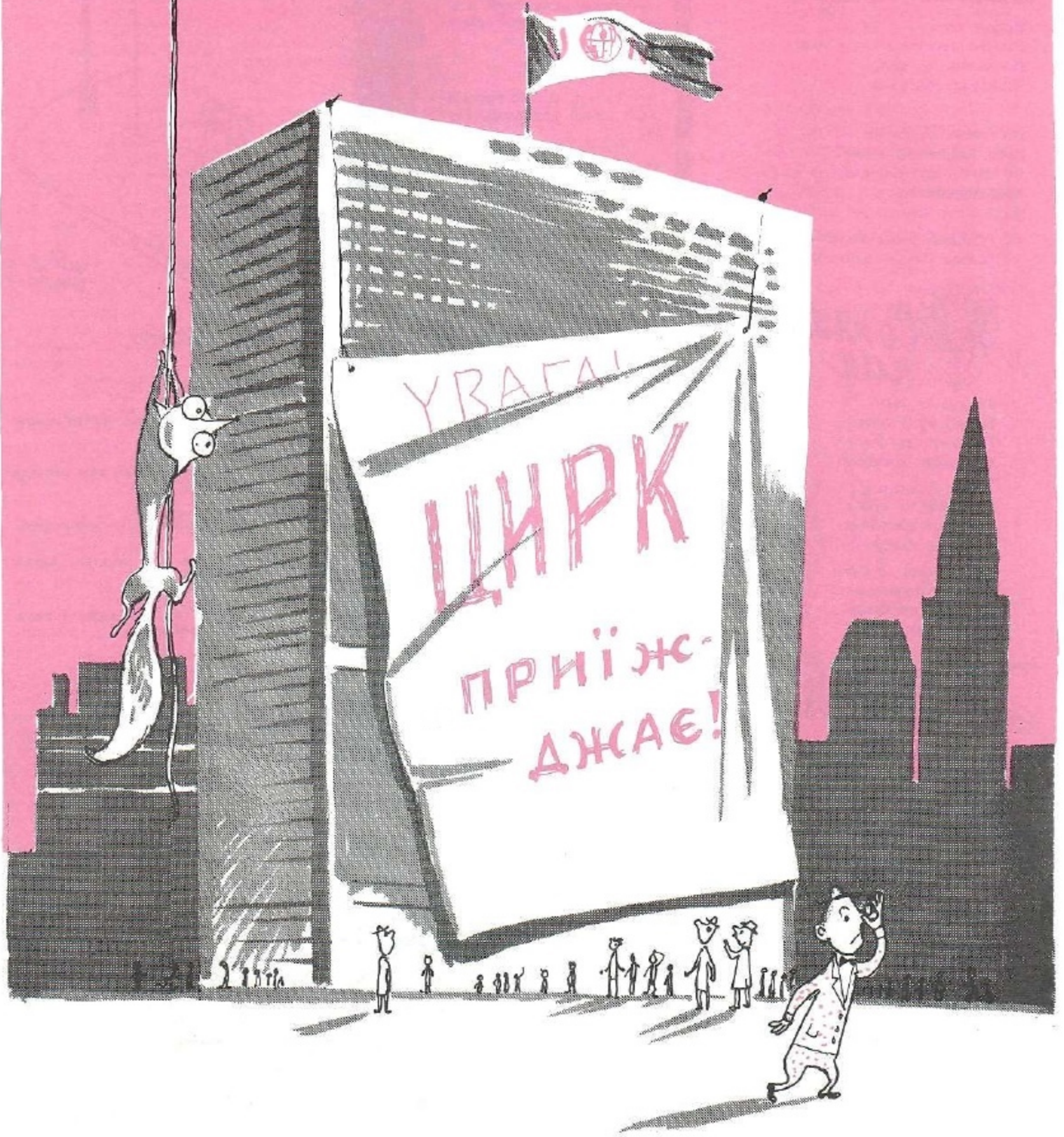
НА ПРИЇЗД ХРУЩОВА ДО ОБ'ЄДНАНИХ НАЦІЙ