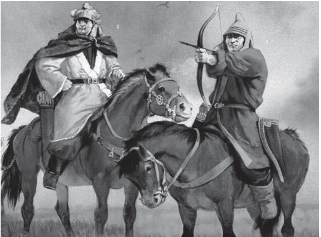
Мал.4. Хунські лучники. Сучасна реконструкція.