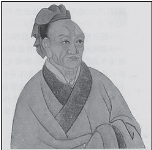
Мал.6. Видатний китайський історик кінця II ст. до н.е. Сима Цянь.

“крил” імперії Хунну (поділ держави на “крила” та “центр” – нововведення Моде) доходила до 170-200 тис чоловік. За умови, що шаньюй мав у своєму підпорядкуванні приблизно таку саму кількість воїнів (як і командувачі “крил”), то в сукупності це дійсно складало близько 250-300 тис людей [27, с. 57].