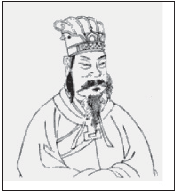
Мал.7. У-ді, сьомий імператор Західної Хань. Класичне зображення.

У наймогутнішій зі степових армій усіх часів і народів – монгольській, завжди панували традиційно “лучні” принципи ведення бою: “Вони [монголи] неохоче вступають у бій, але ранять і вбивають людей та коней стрілами, а коли люди і коні ослаблені стрілами, тоді вони вступають з ними у [справжній] бій” [24, с. 109].