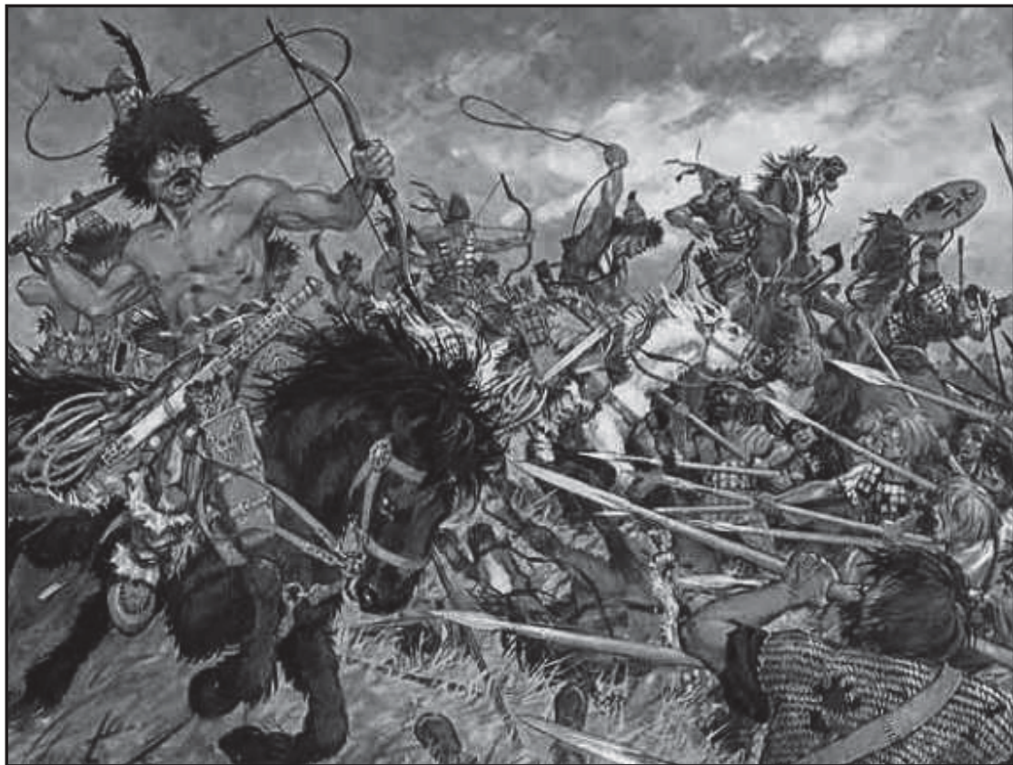
Мал.5. Хунну в атаці. Сучасний малюнок.

лазутчиків та істориків. Найбільша чисельність хунських воїнів – 400 тис вершників – вказана Сима Цянем у 110-му цзюані “Ши цзи” [19, с. 175], в описі знаменитої Байдинської битви 200 р. до н.е. між Моде і Гао-цзу, хоча перед тим, у 99-му цзюані цього ж трактату [19, с. 164] він наводить інше число хунських вершників – 300 тис чоловік. До останньої цифри, як більш вірогідної, схиляється, наприклад, В. Таскін, який узагальнив усі основні повідомлення писемних джерел [54, с. 152]. Його позицію підтримує і Л. Боровкова [27, с.55-57].