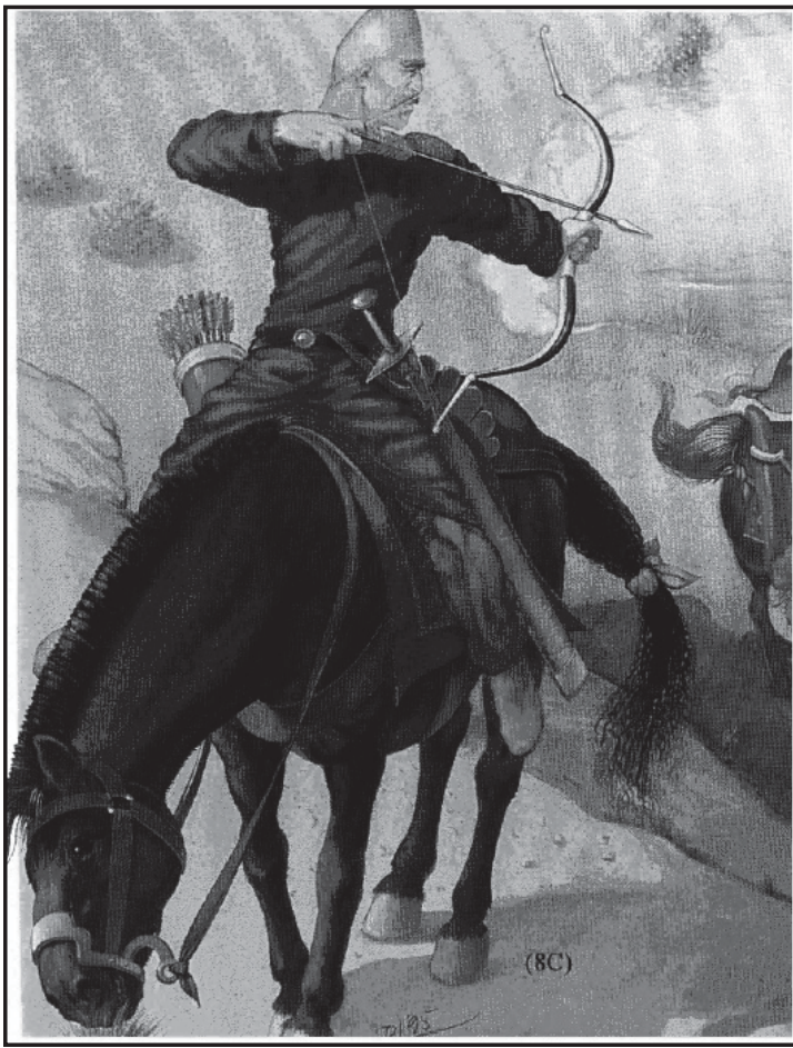
Мал.10. Гунський вершник-ефталіт (білий гун).

виявлялись первопричиною насильства, воєн і грабіжницьких походів. Існує багато прикладів, коли їх на це провокувала агресивна політика сусідів, на яку номади змушені були реагувати адекватно.