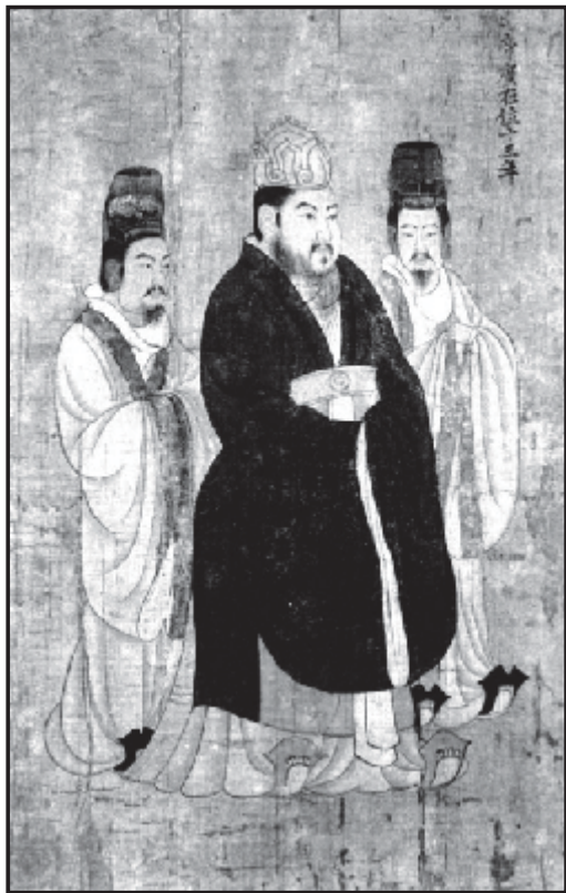
Мал.8. Імператор Західної Хань Вень-ді. Традиційне зображення.

кинутися в рукопашну сутичку, внаслідок чого протиборчі сторони пішли на укладення миру. Однак у той самий час хунські двосічні палаші були довші ніж акинаки, – головна зброя народів Саяно-Алтаю, що, на думку Ю. Худякова, зумовило перевагу у ближньому бою хунської кінноти [60, с. 51-52].