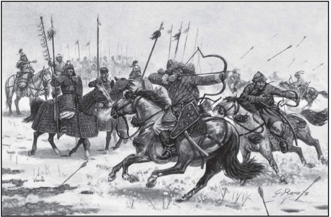
Мал.3. Кіннота хунну. Сучасна реконструкція.