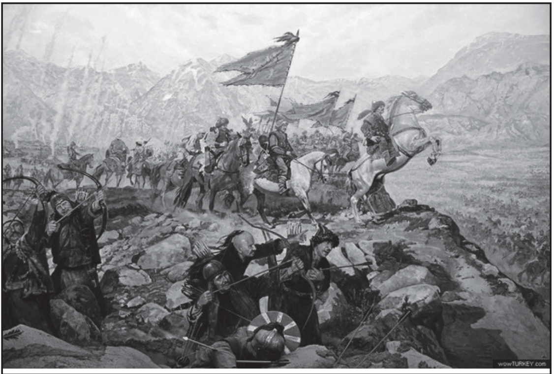
Мал.2. Армія хунну готується розпочати битву.