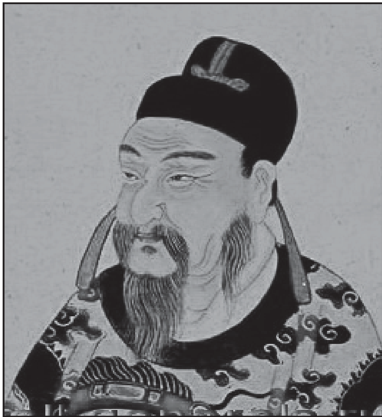
Мал.1. Перший імператор Західної Хань Лю Бан (Гао-цзу). Стилізований малюнок.

після чого вирішив захопити та пограбувати багаті прикордонні міста Уаона й Луші. Його 300 000 армія ніде не стикалась із серйозним спротивом, оскільки імператор Лю Бан (256-195 рр. до н.е.; перший імператор династії Хань) (див. мал. 1) воював на той час (201 р. до н.е.) із Сян Юйєм (232-202 рр. до н.е.; китайський полководець – “Верховний правитель Західного Чу”, який у 208-202 рр. до н.е. очолював рух ванів і хоу (князів) проти династії Цинь). Зрештою, переможна війна хунну з пихатим Китаєм дозволила Моде суттєво активізувати свою дипломатію й зміцнити владу в самій імперії Хунну, яка значною мірою ґрунтувалась на силі й авторитеті війська.