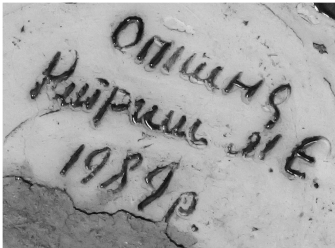
Фото 2–4. Малий епіграфічний напис на виробі Михайла Китриша (фрагмент). Опішня, 2018.

Прикметно, що більшість робіт підписані автором, що значно спрощує їхню атрибуцію. Ці підписи достатньо різноманітні й можуть слугувати окремим джерелом для епіграфічних та керамологічних досліджень. За твердженням дослідників опішненські гончарі масово почали підписувати кераміку у 1969 році. До цього часу вироби в більшості були безіменними: «нарешті 1969 року опішняни вперше побачили під своїми виробами свої імена. Й збагнули, що Опішня не масовість, не «інкубаторний» півник, коник чи левик з ім'ям ширпотреб; Опішня – то динаміка й пластика, несподіваність, думка і філософія; Опішня – це унікальне передмістя ще городотівської столиці полян Гелона, своєрідний – од віку до віку, з таїни в таїну, з глибини в глибину!.. – національний голос, що його можна чути, впізнавати, навіть не убачивши, хто говорить; ним можна жити, вчаровуватися, печалитися» 1 , – писав на початку 1990-х років Олексій Дмитренко. Красномовним у цьому плані є вислів одного із найстаріших гончарів Опішного Івана Білика: «Ми були безіменні. Й воно, ото, знаєте, схоже на те, що головний інженер [Трохим Демченко] тримав нас у погребі, а Петро Олександрович [Ганжа] узяв та й ляду відкрив. І вилазьте на світ, каже...» 2 .