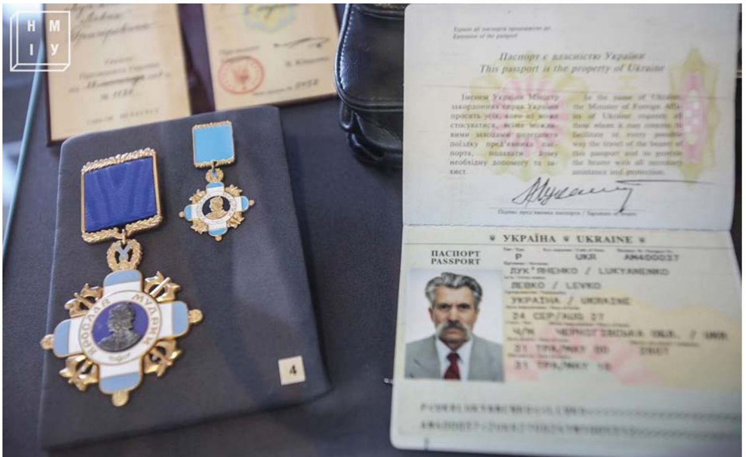
Рис. 6, 7