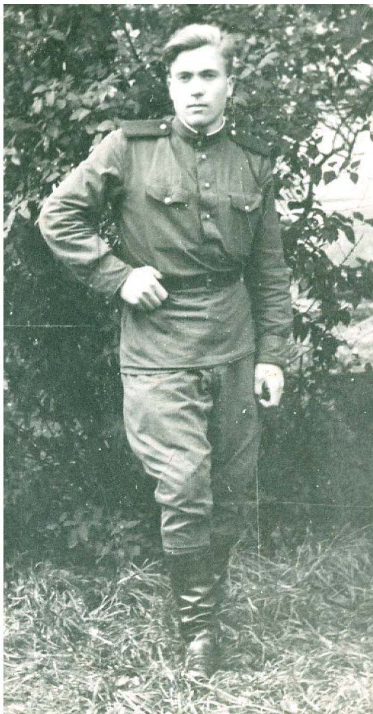
Рис. 1, 2