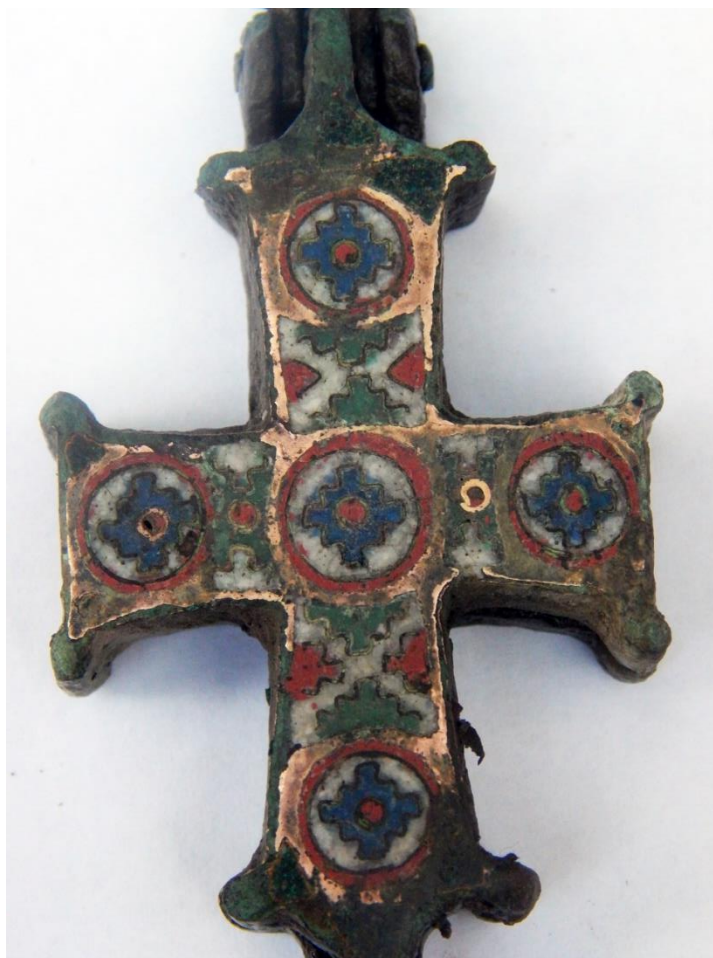
Рис. 3. Хрест в емалях. Хмельницька обл.