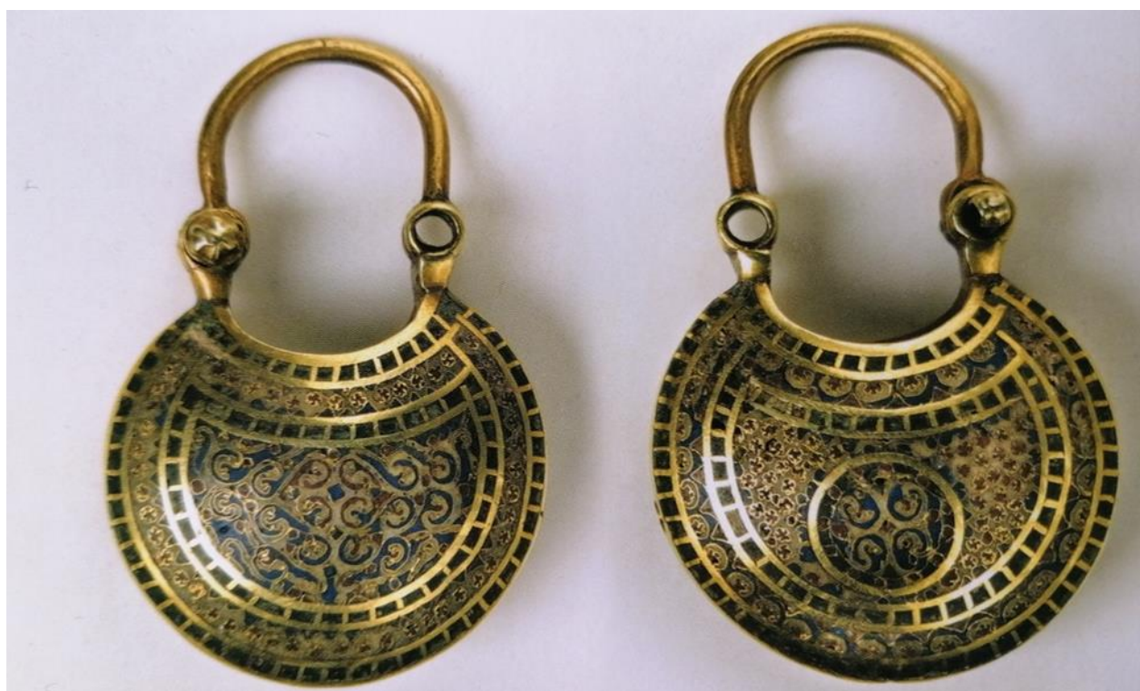
Рис. 5. Імпортний (візантійський) золотий колт з Галича