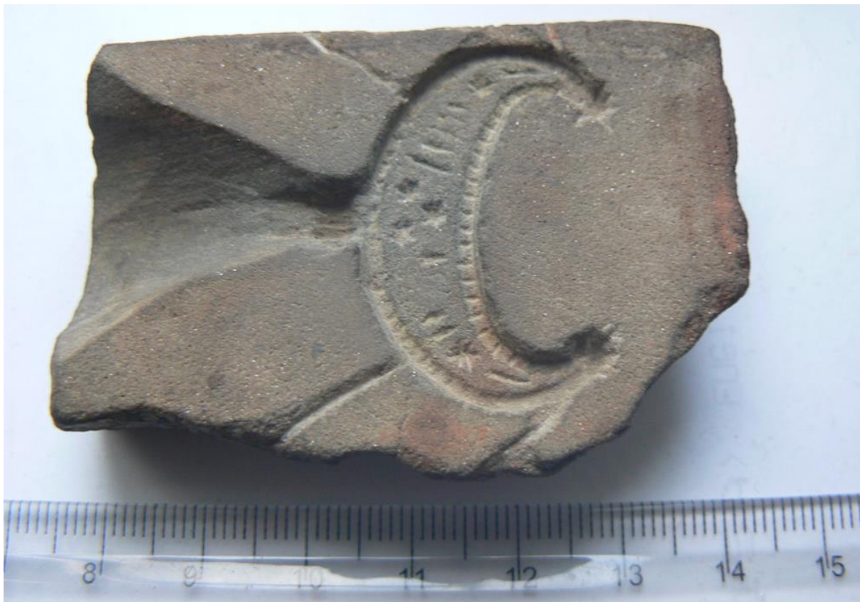
Рис. 2. Ливарна формочка лунниці. Хрінники Рівненської обл. Фото Г. Охріменка (Фонди ВКМ)