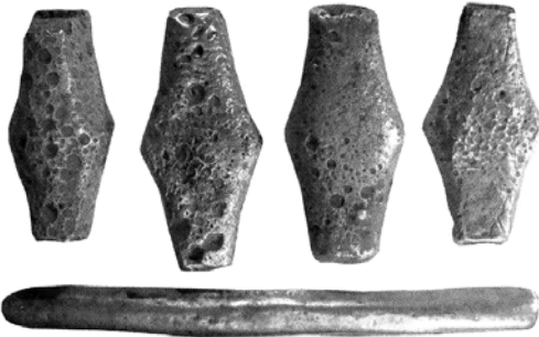
Ил. 1.1 – скарб із Крилоса; 2 – солід Іраклія I (610–641) з околиць Раківця; 3 – histamenon Михайла VII (1071–1078) із Залуча; 4 – монети Никифора III (1078–1081) з околиць Галича; 5 – частина скарбу з Крилоса (1 – за Михайлом Фіголем; 2–5 – за Ігорем Ковалем та Іваном Миронюком)