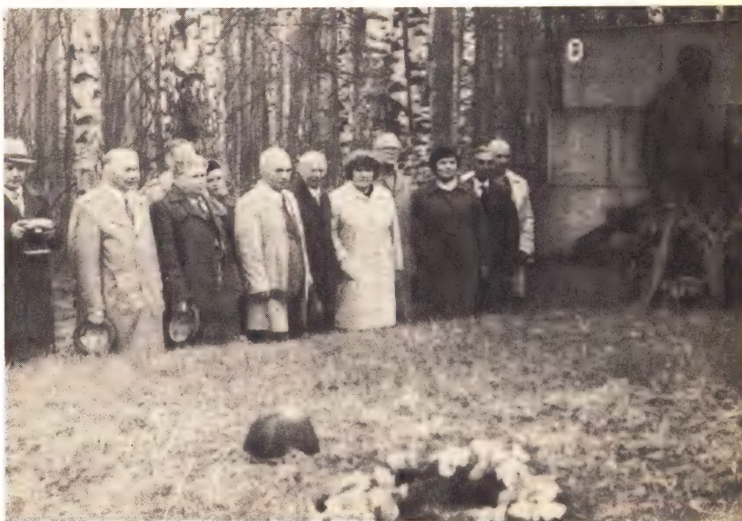
Під час чергової зустрічі в м. Виборгу ветерани 40-го артдивізіону відвідали місця колишніх боїв.