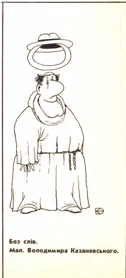
Без слів. Мал. Володимира Казаневського.