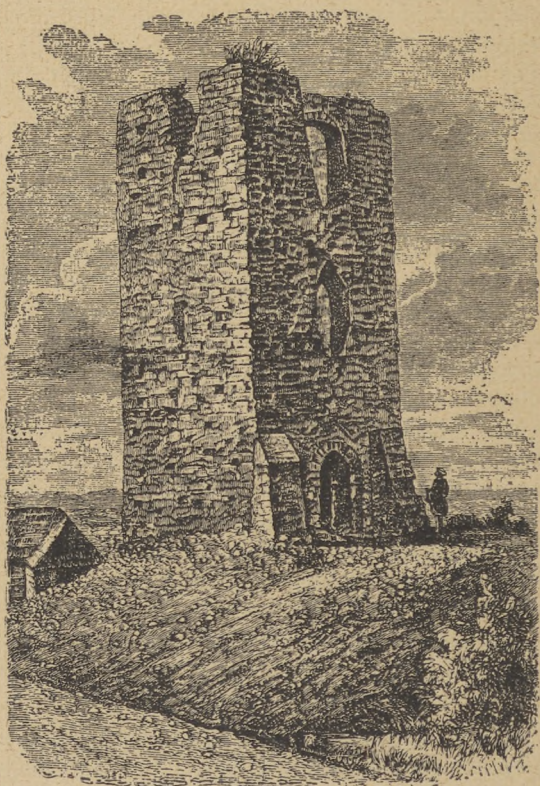
Вежа з княжих часів у Столпю.