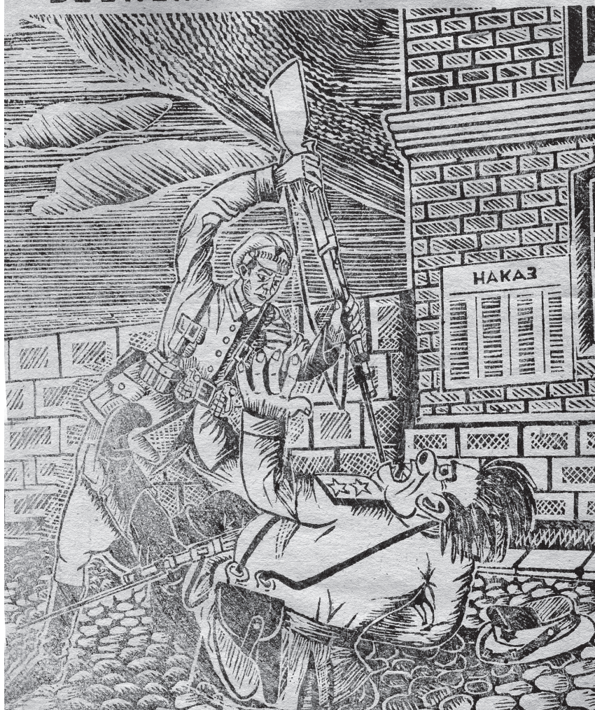
Листівка підпілля ОУН "Відповідь Українських Повстанців на "звернення" т. зв. міністра "безпеки" УСССР Ковальчука" (з фондів ГДА СБУ)