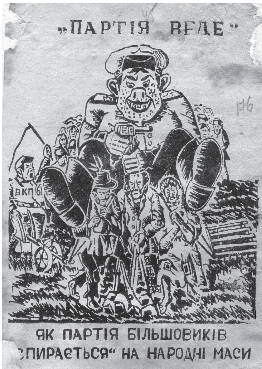
Листівка підпілля ОУН "Партія веде (як партія більшовиків "спирається" на народні маси)"