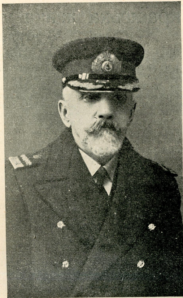
Української Державної Фльоти Генерал-Хорунжий по Адміральству Володимир Олександрович Савченко-Більський.

Г. л. Савченко-Більський був одним з головних організаторів Українського Морського Відомства: Морського Секретарства — пізніш Морського Міністерства у Києві від першого дня його існування: 22. грудня 1917 р., коли наказом по Генеральному Морському Секретарству ч. 1 б. з 23. грудня 1917 р. його призначено Директором Канцелярії Морського Міністерства. На цьому становищі він пробув беззмінно до 5. січня 1920 р. Одночасно, в зв'язку з формуванням частин Укр. Морської Піхоти у 1919 році (березень-травень) під Бродами і в Коломиї, Ювілята був представником Морського Міністерства при Держ. Секрета-