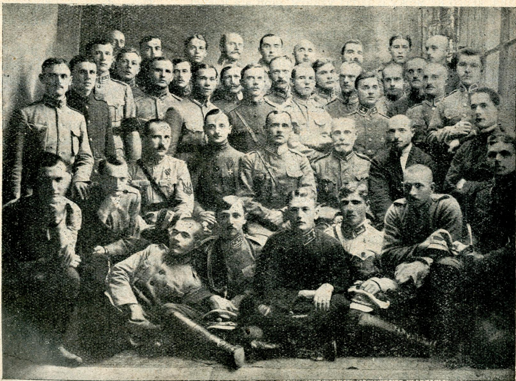
ГРУПА СТАРШИН СПІЛЬНОЇ УКРАЇНСЬКОЇ ЮНАЦЬКОЇ ШКОЛИ 1920 Р.

В жовтні 1919 р. школа урочисто зробила свій перший випуск молодих хорунжих. То були не аби-які хорунжі! Бо ж тактики, цієї основної военної науки — умілости вчилися не з сухих підручників, знання свої переводили не на військових „іграх“, що при всій ніби реальності показу все ж тільки „военною грою“ — знання свої перевіряли в обстанові правдивого сучасного маневрового бою, маючи перед собою не „означеного“ противника, якусь тим „синю“, а так-таки справжню „червону армію“ — „розігравали“ бій, почавши від висилки польової стежі та від першого далекого гарматного стрілу й перейшовши через всі стадії розвитку бою,