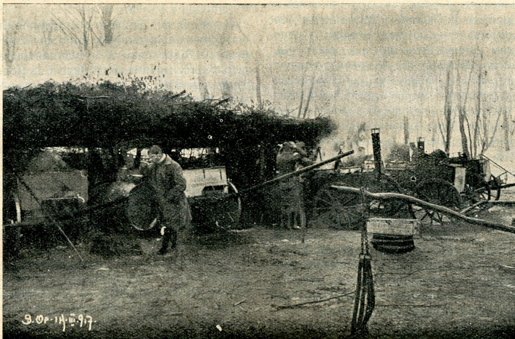
Стрілецькі кухні під фронтом у Соснові в березні 1917 р.

і вигоду військової кухні. Вона і підчас походу могла варити для відділу їду. Найскорше вирішили справу німці, які вже в 1905 р. розписали кон-